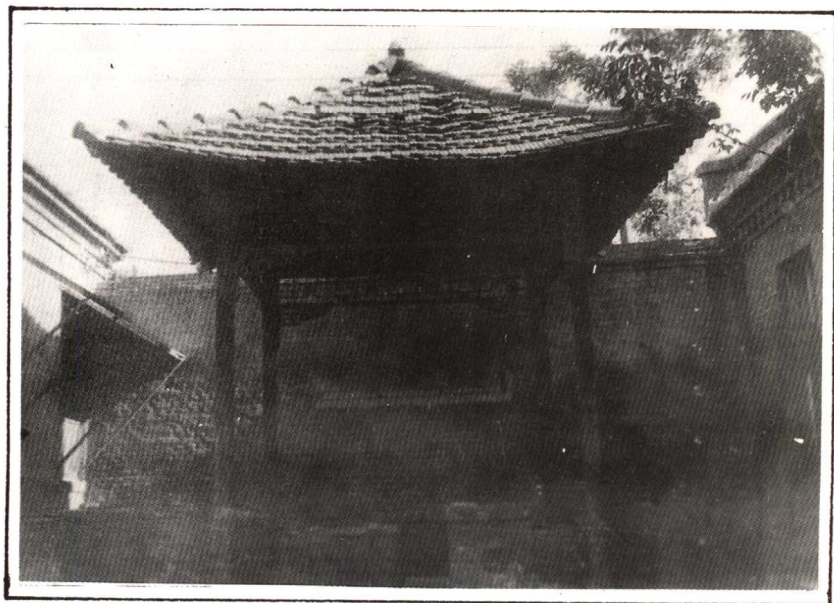
解放前济南成通纱厂的放工亭(搜身亭)