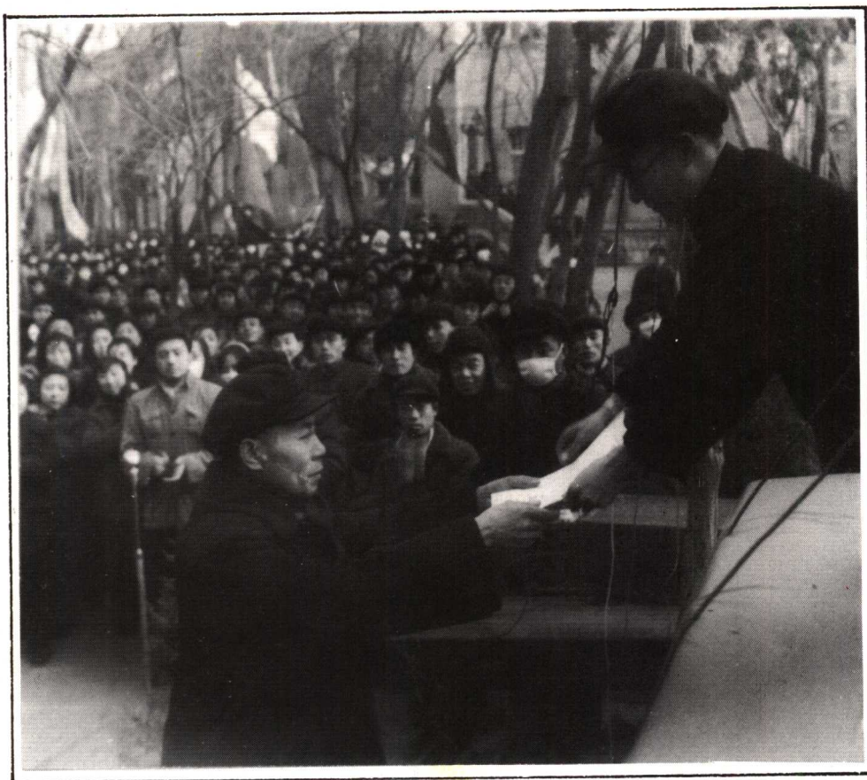
许衍梁副市长向申请公私合营的行业颁发批准书。