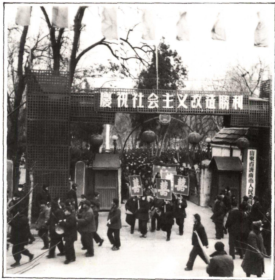
濟南市資本主義工商業實現全行業公私合營後，紛紛到市人委報喜（1956年1月19日）。