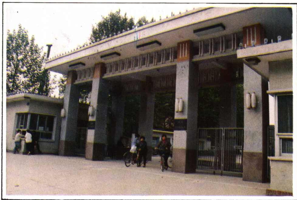
济南第四棉纺织厂(原成通纱厂)