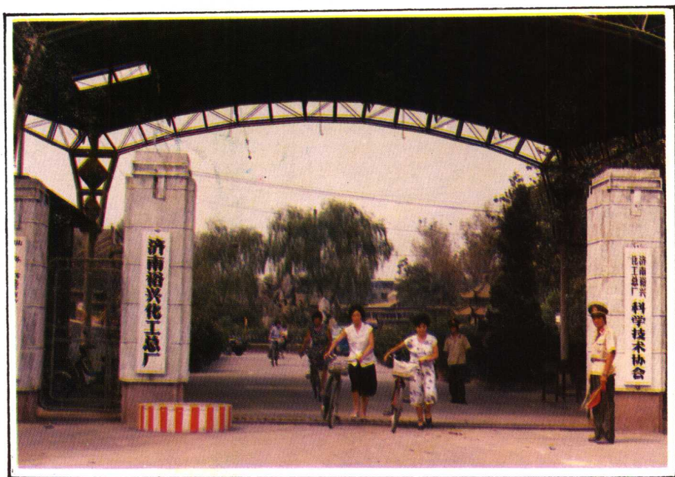
今日的济南裕兴化工总厂