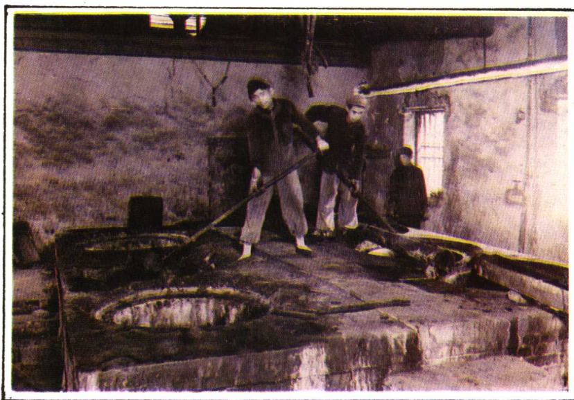
公私合营前裕兴化工厂煮青生产操作情形