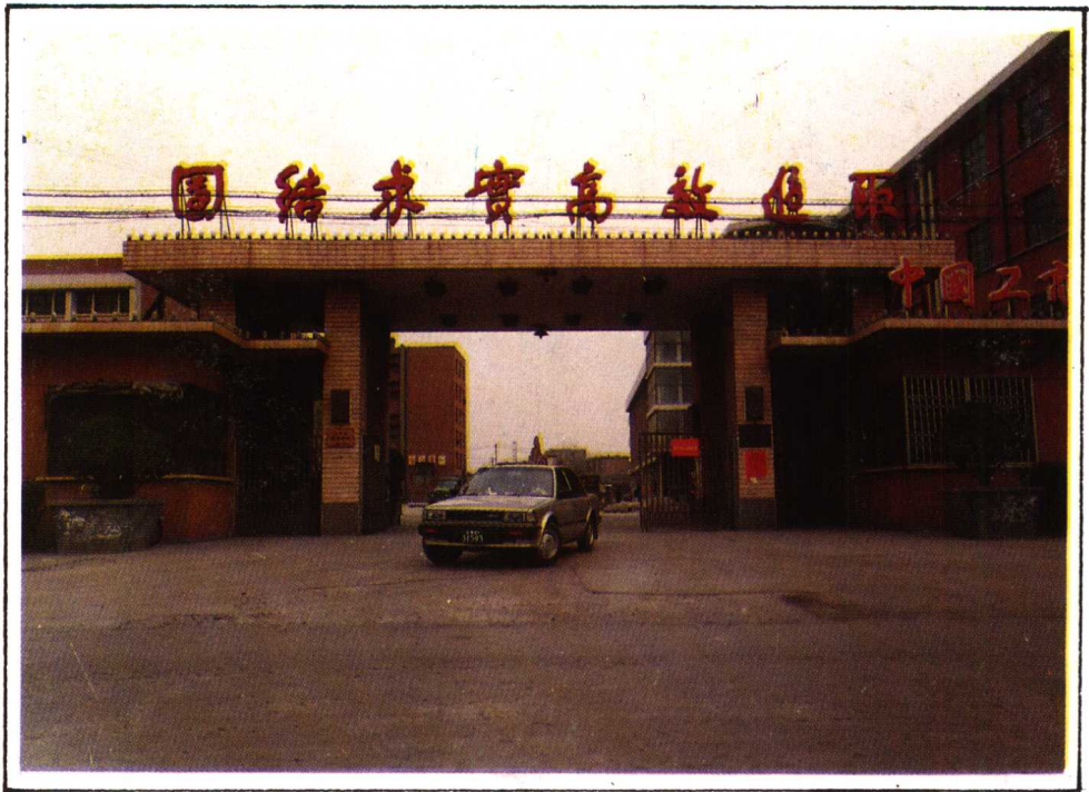
济南第二印染厂(原东元盛染厂)