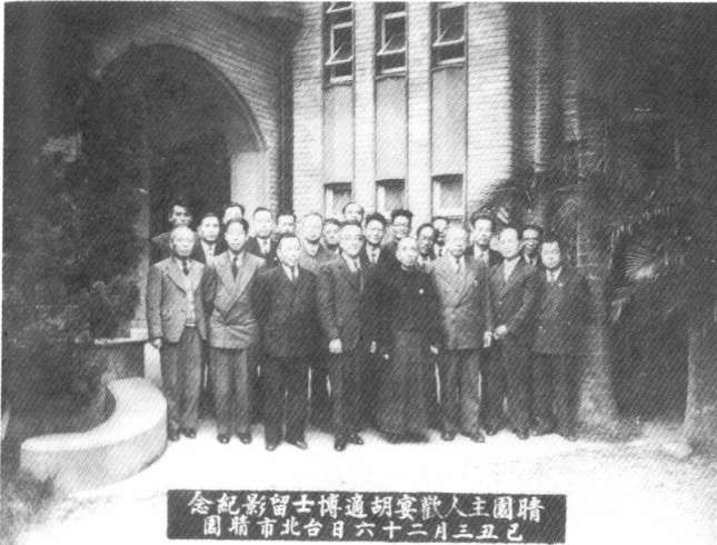
1949年3月，晴园主人黄纯青（前排右四）欢宴胡适（左四）合影，前排右三为傅斯年。