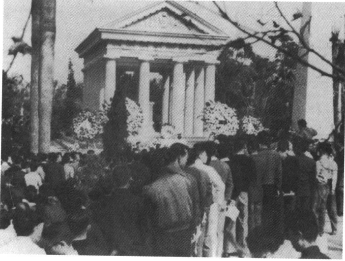
傅斯年去世后，安葬于台大傅园。