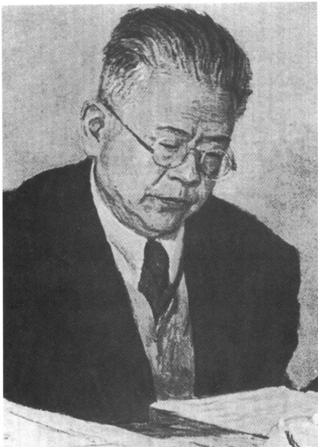
傅斯年先生处理公文时的神情。