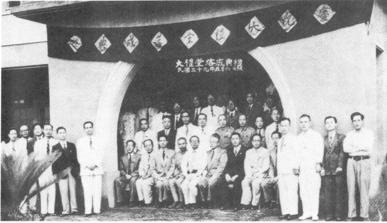
1950年，台大大礼堂落成典礼，一排右八为傅斯年。