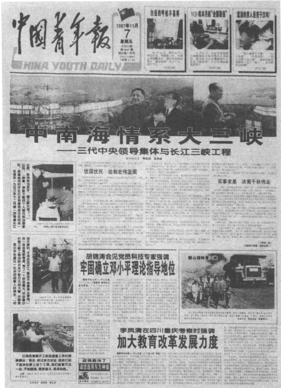
中国青年报 1997年11月7日第一版 (获第八届中国新闻奖三等奖) 版面编辑 / 陈泉涌 张桂明 张立功

图片、标题是报纸的眉目，常说一个人眉目清秀是个美人，报纸的“眉目”同样如此，标题、图片该大则大，该小则小，突出重点，层次“拉”开，不要混着一起，这是对版式的基本要求。