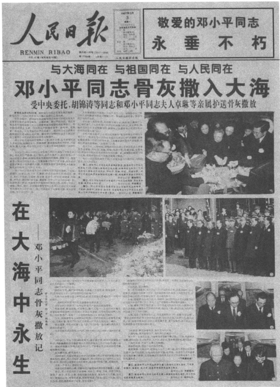
人民日报 1997年3月3日第一版 (获第八届中国新闻奖三等奖)

作为中国主流报纸的代表——《人民日报》，其版式一直保持着简单、大方的风格，以大家风度，影响着中国报纸的版式面容。1997年3月3日的《邓小平同志骨灰撒入大海》一版，更是以通栏大标题大图片贯穿于全版，全版没有多余的修饰，以最简单、最朴实的版式语言，表达出最重大的历史主题。