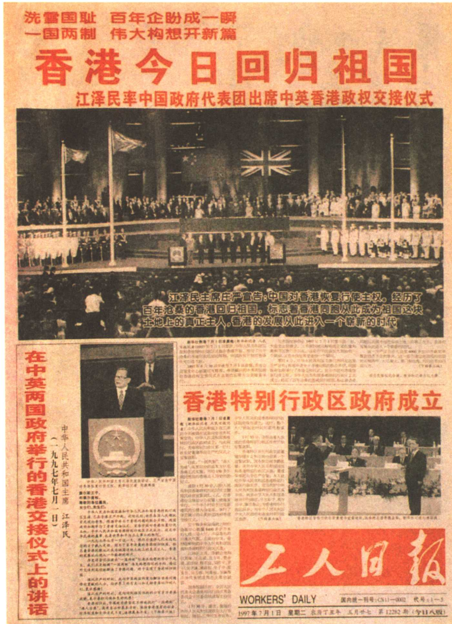
工人日报 1997年7月1日第一版 (获第八届中国新闻奖二等奖) 版面编辑 / 范瑞先 杨军 王金海

现代版式除强调大标题、大照片外，更强调多导读，甚至导读区要比内文多。《工人日报》的香港回归专版充分体现了这种现代版式语言。