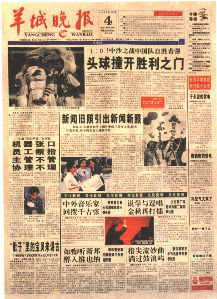
羊城晚报 1997年10月4日第一版 (获第八届中国新闻奖一等奖)

此版堪称现代报版的代表之作，标题全部用横题，专栏全部整齐划一，巧妙地运用“碰题”和“断版”，既“突破”，又“合情合理”。文章分类明确，层次分明，体现出现代报版的重要特征——条理性强。