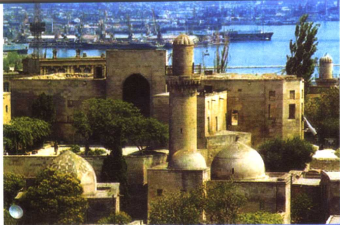
希尔凡汗王宫（巴库）