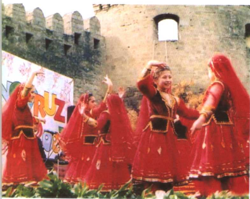
节日里的阿塞拜疆儿童