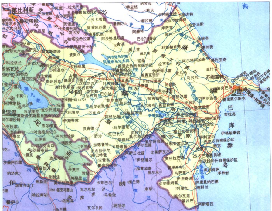
阿塞拜疆行政区划图