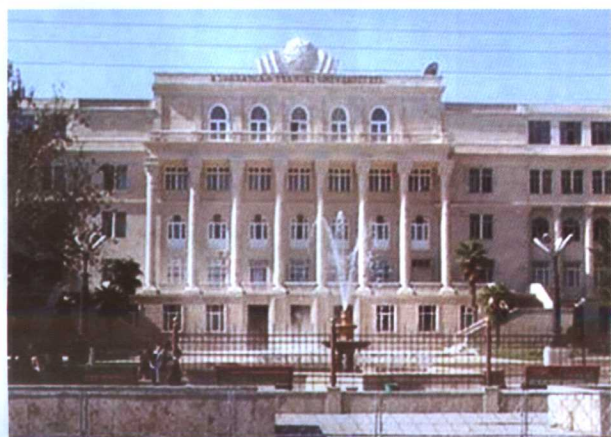
阿塞拜疆技术大学主楼