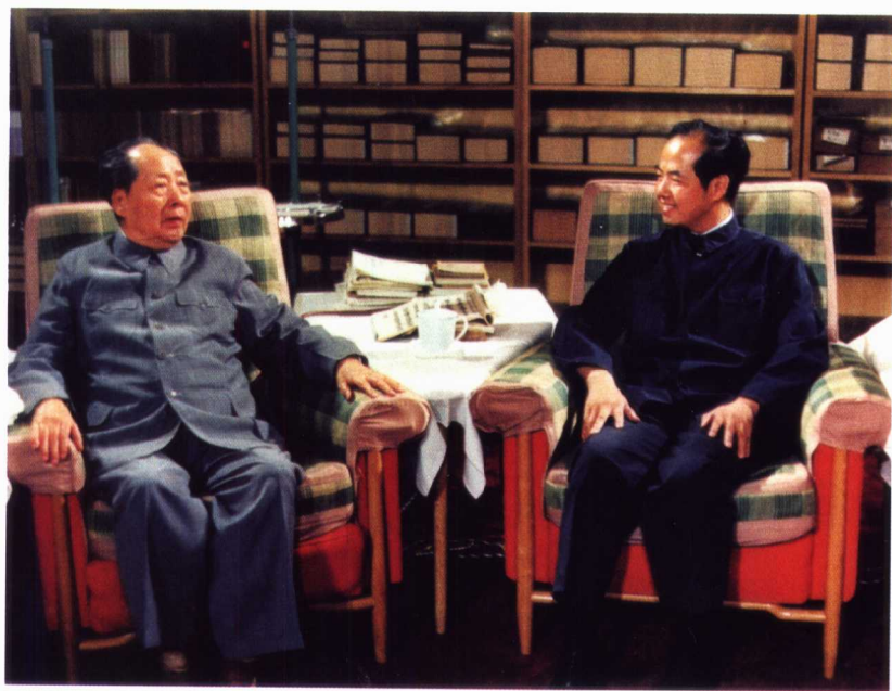
毛泽东在中南海会见美籍物理学家李政道（1974年5月）