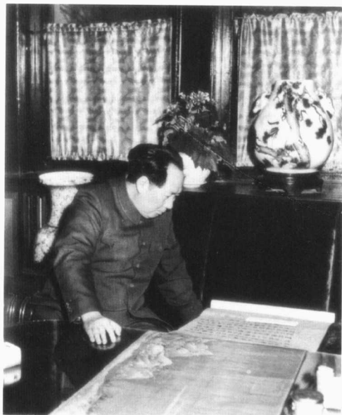
毛泽东欣赏中国古画（1953年）