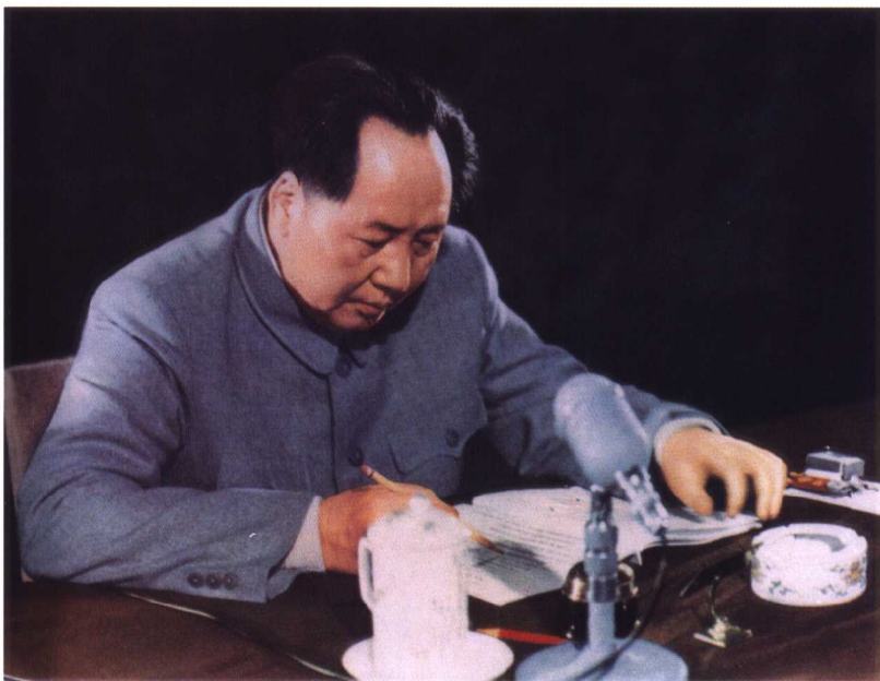
毛泽东在修改《中华人民共和国宪法》(草案) (1954年)