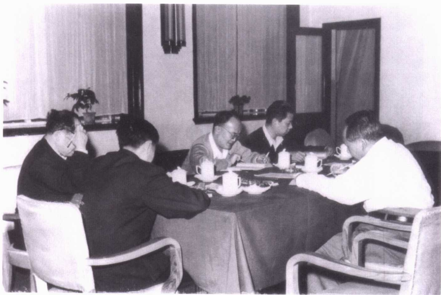
毛泽东与胡绳、田家英等一同研读苏联《政治经济学 （教科书）》第三版（1959年12月至1960年2月）