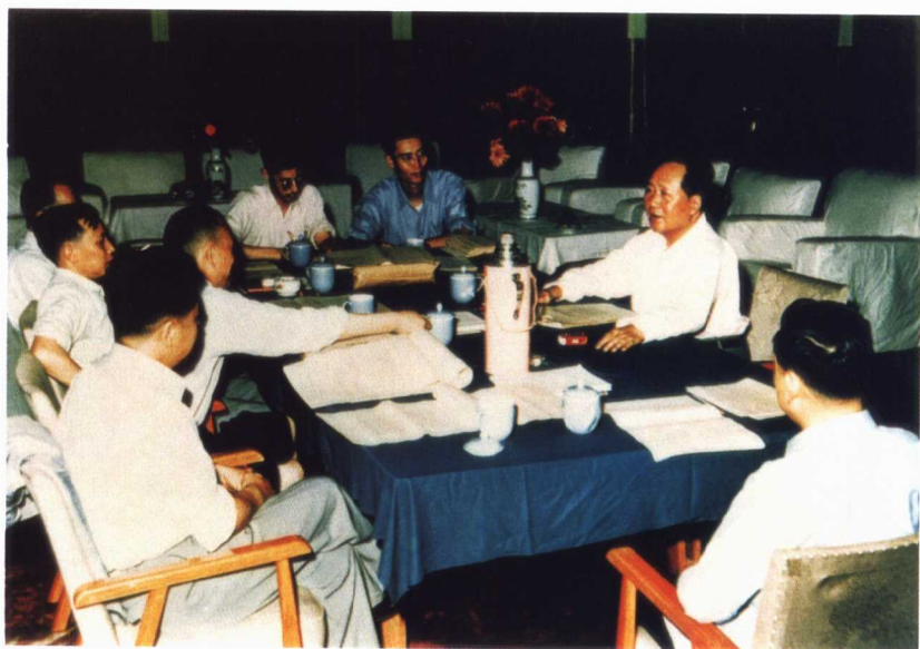
毛泽东在广州和有关同志研究《毛泽东选集》 第四卷的编辑工作（1960年4月）