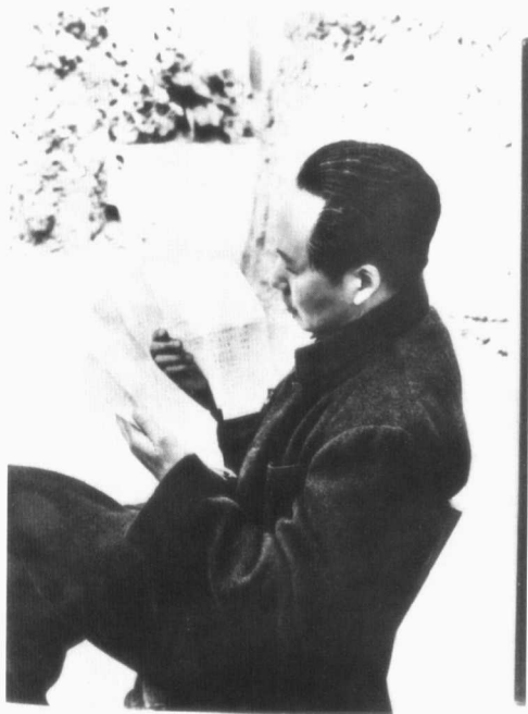
毛泽东在审阅文件（1946年）