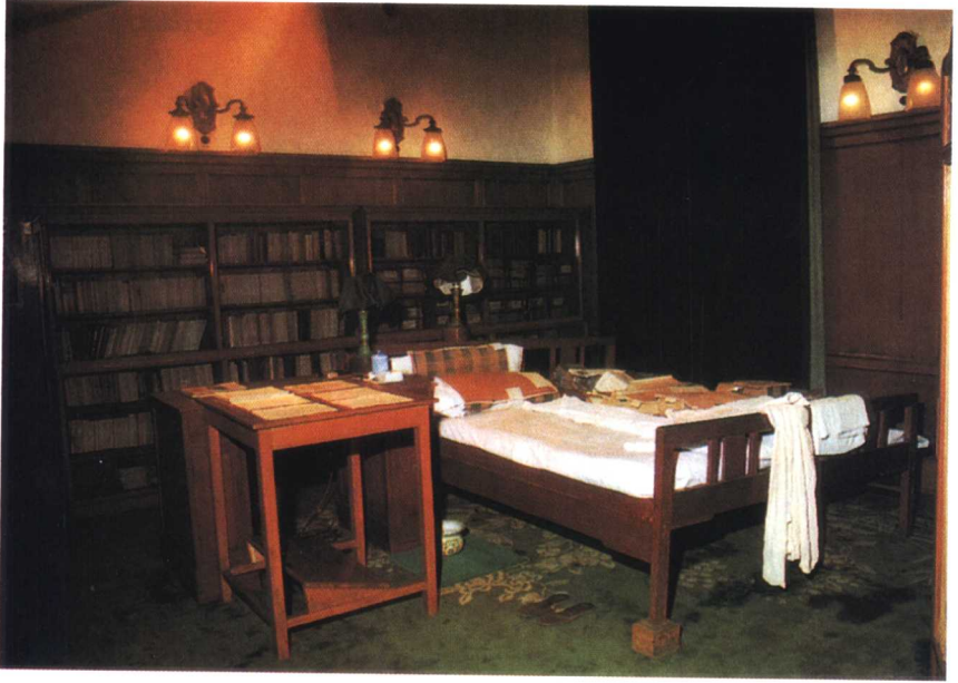
毛泽东在中南海菊香书屋的卧室