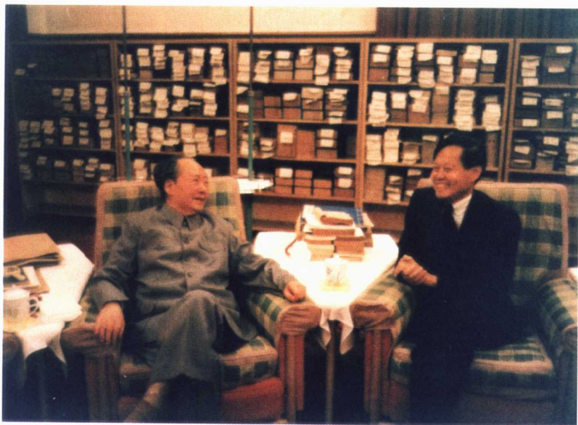
毛泽东在中南海会见美籍物理学家杨振宁（1973年7月）