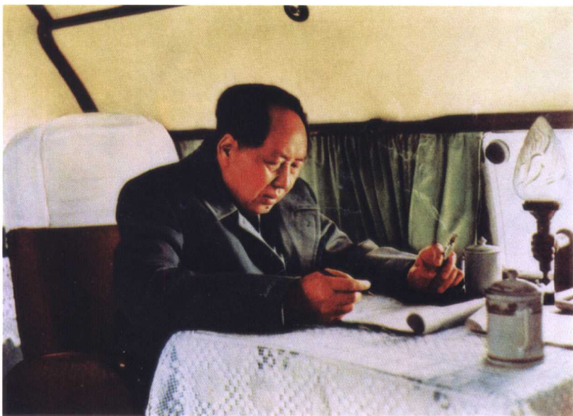
毛泽东在飞机上学习英语 (1957年)