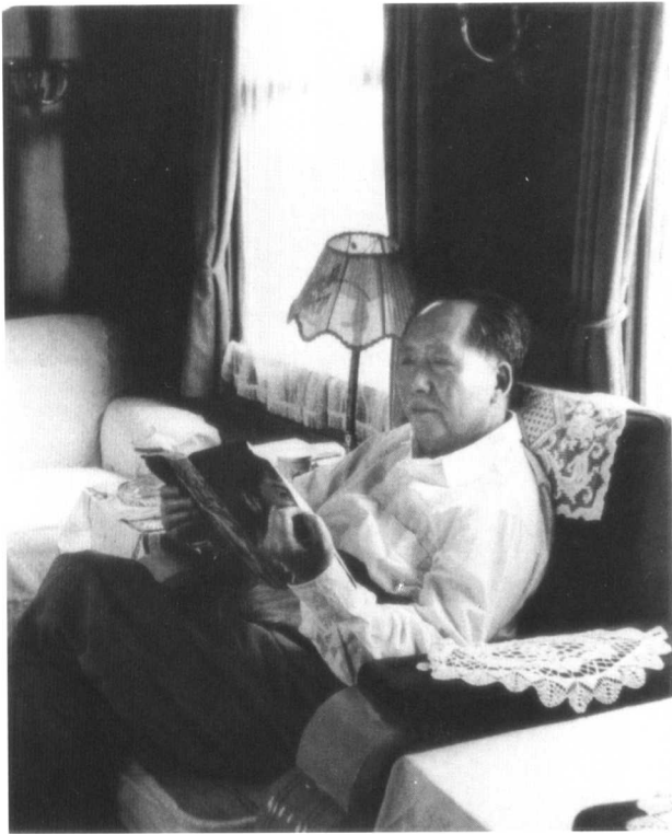
毛泽东在专列上看《大众电影》（1962年）