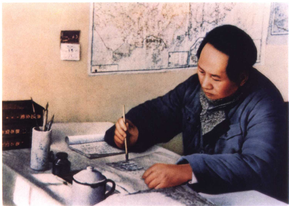
毛泽东在枣园窑洞工作（1946年）