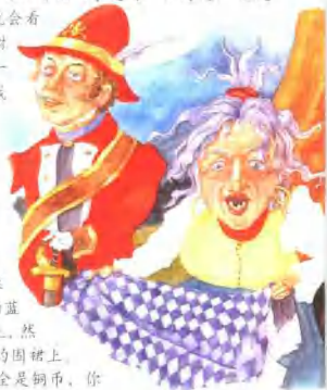
巫婆把自己的蓝格子围裙交给士兵，让他到树洞里去打火匣。

“你这个好家伙！”士兵说着就把狗抱到巫婆的围裙上。然后他拿了满满一口袋铜币。他把箱子锁好，把狗又放到上面。接着，他打