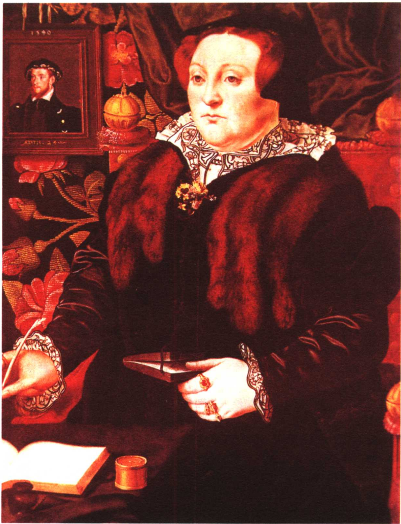
图3 汉斯·埃沃斯《玛利·内维尔》，1555年，油画，73.7厘米×57.1厘米，渥太华加拿大国家美术馆。