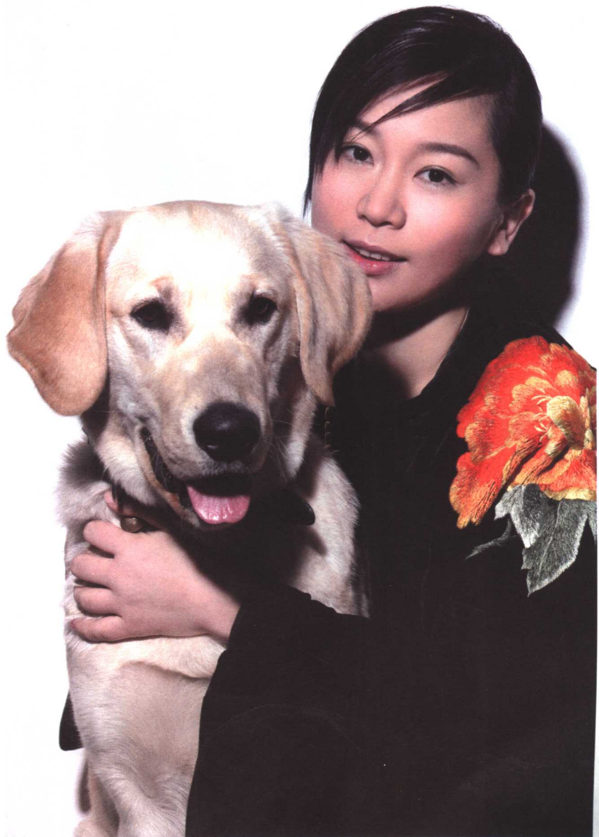
作者（右）和她的小狗毛弟