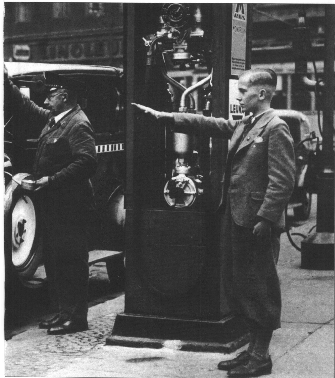
当希特勒通过广播发表进攻波兰的讲话时,柏林的一个出租汽车司机、一个汽车厂的维修工和一个衣着整洁的年轻人在敬礼。