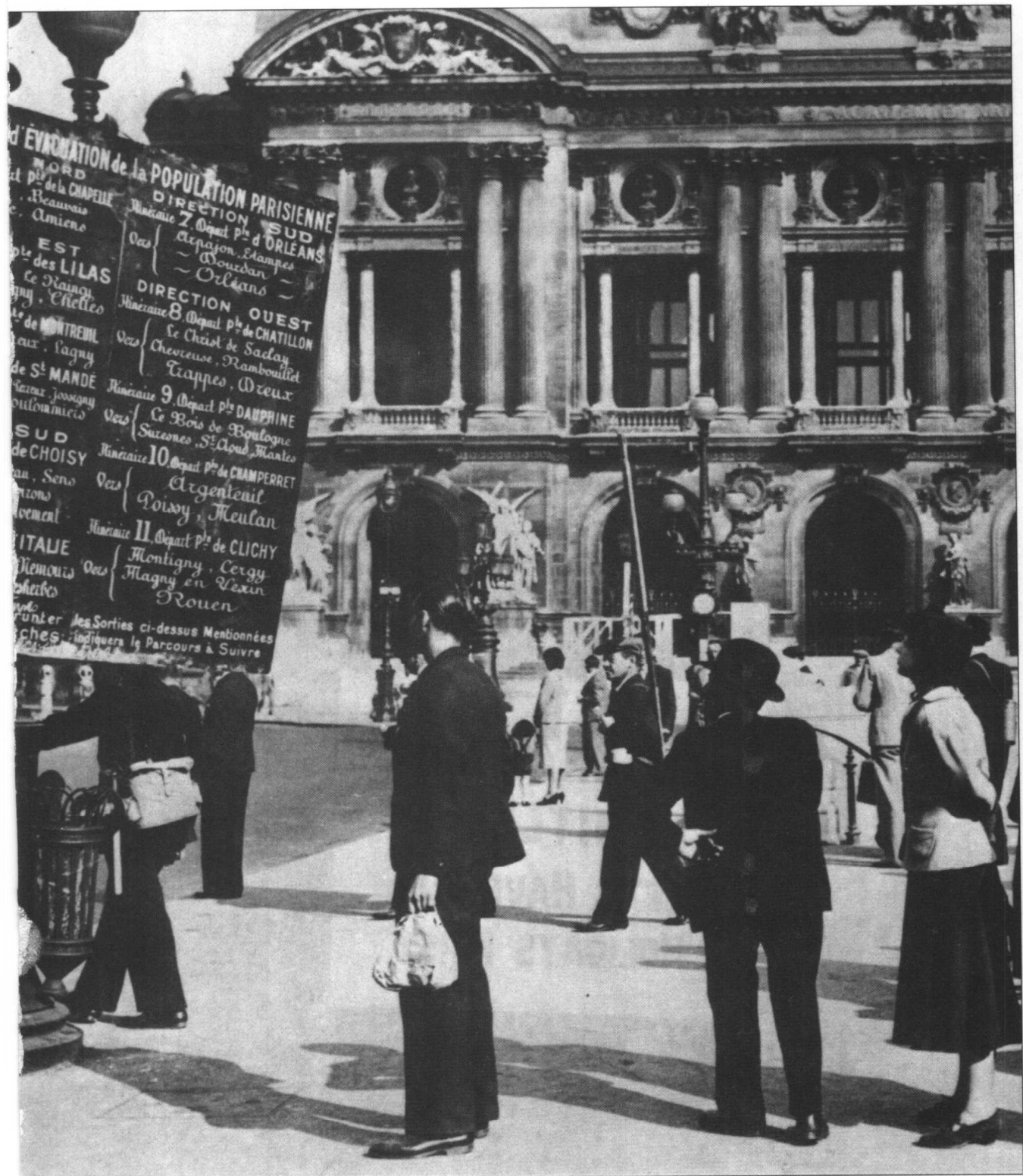
在巴黎剧院附近，一群逃难者在查看能向市外疏散的路径。最后两个人小心翼翼地携带着他们的防毒面具。