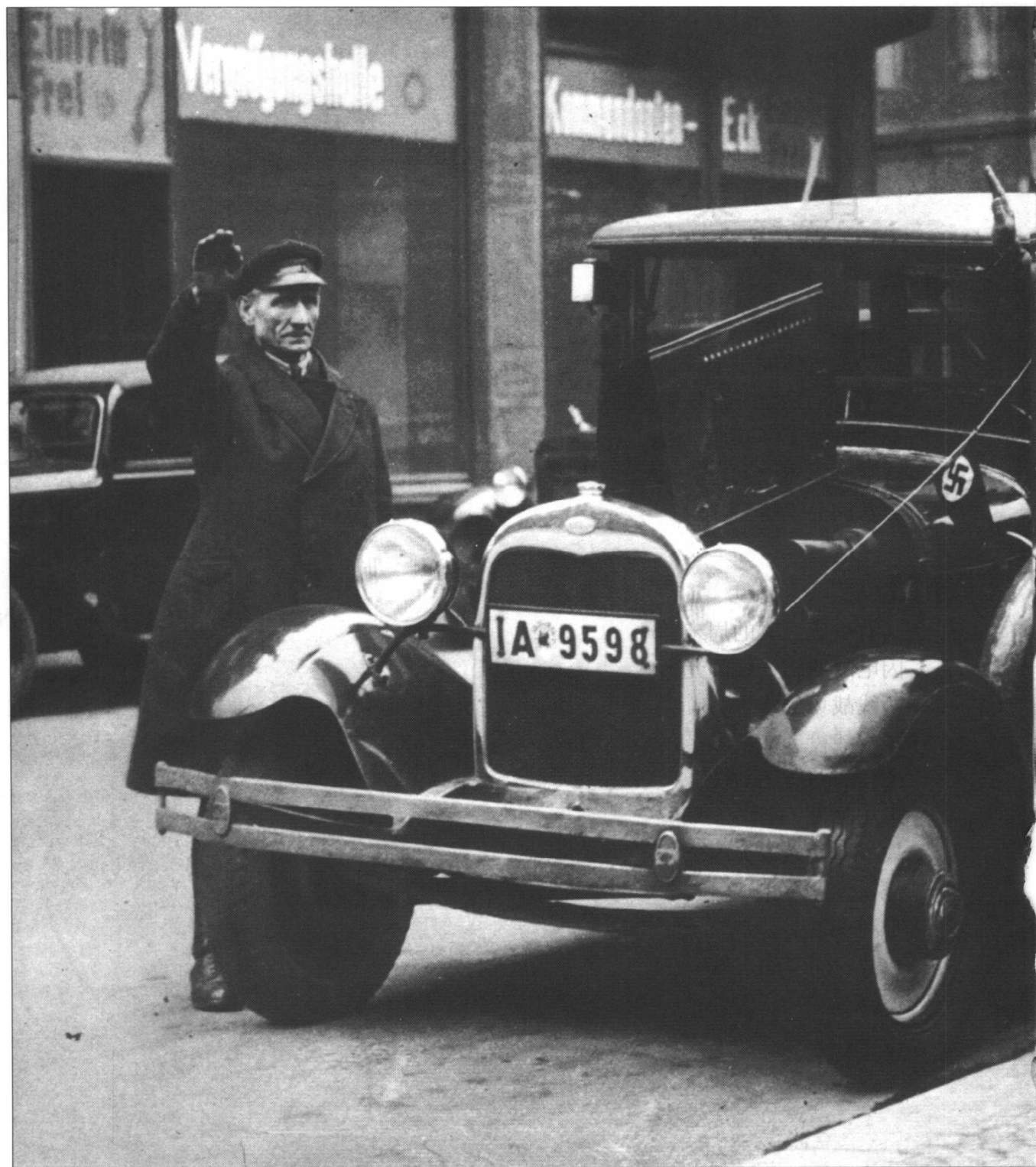
具有决定意义的周末