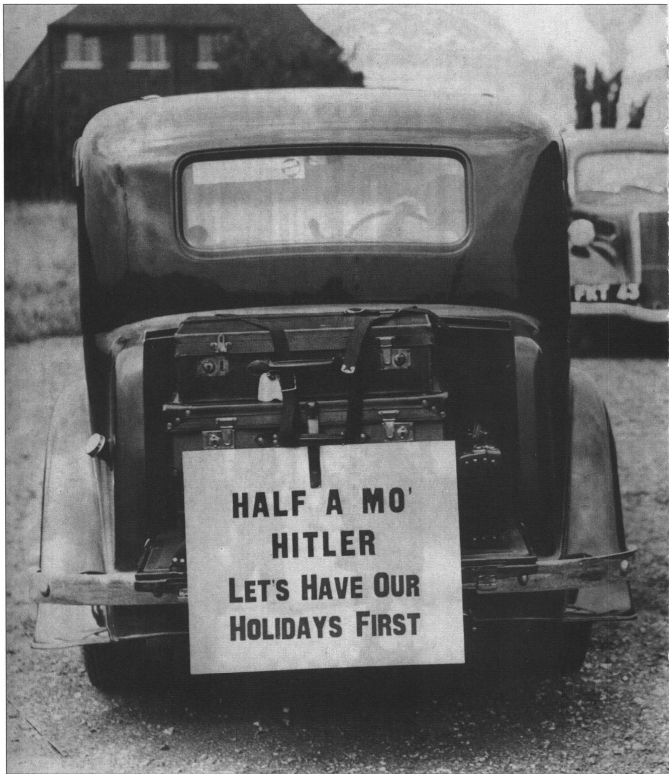
一辆满载行李的小汽车上打出的一条令人兴奋的标语,表达了一个英国人的意愿,不要让战争爆发,以免破坏他愉快的假日。