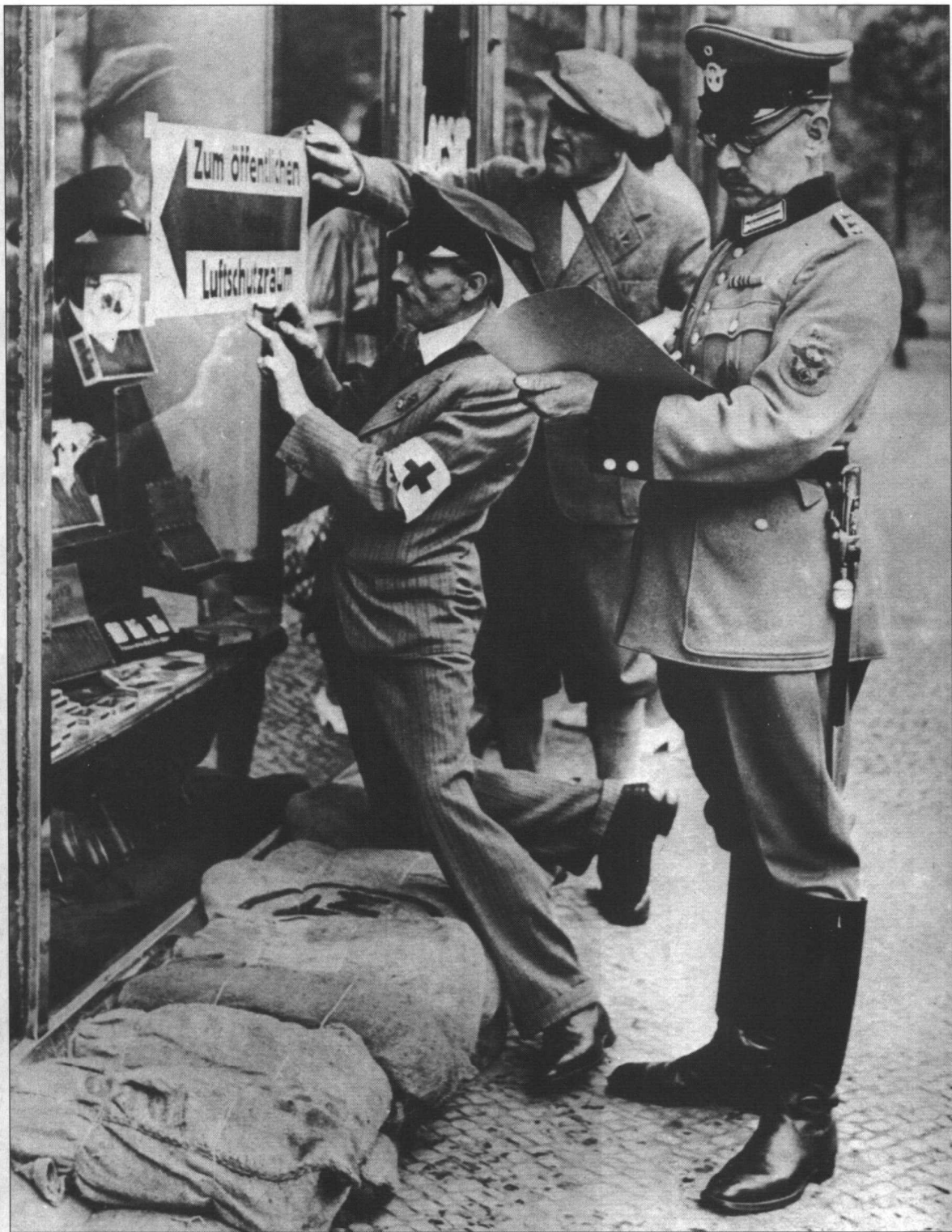
在一名警察的监视下，柏林的一名志愿者跪在沙袋掩体上，在一家商店的窗户上张贴空袭掩体的标志。