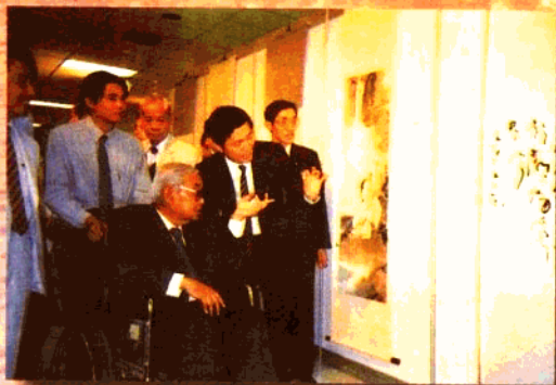
泰国前国务院长克里·巴莫亲王 观看如东赴泰书画展