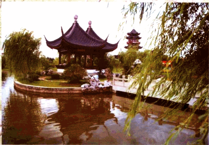
公 园 一 角