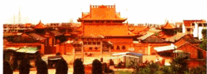
清 国 寺