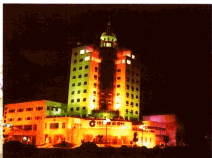
光 流 彩 溢