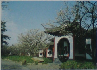
充满着古典风韵的园林景观