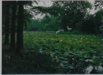
洋溢着自然气息的近代园林景观