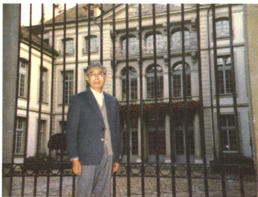
➤ 1986年秋摄于瑞士伯尔尼，黑格尔任家庭教师的贵族施太格旧居前