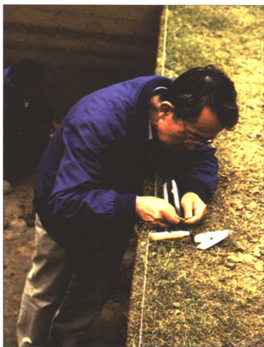
◎观察商丘虞城县马庄新石器时代墓地出土陶器 商丘 [1994]