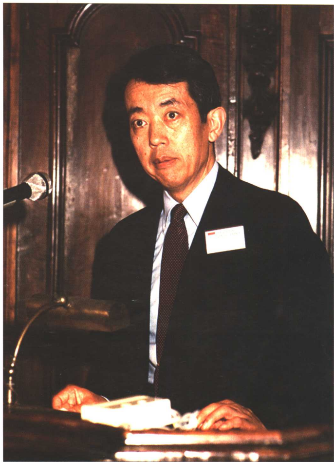
◎在意大利威尼斯古代中国文明会议上发言 [1985]