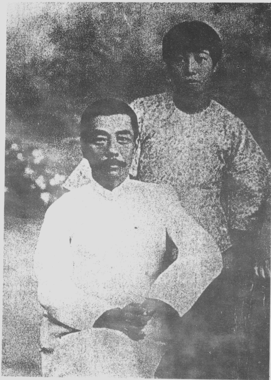
鲁迅、许广平 1927 年在广州