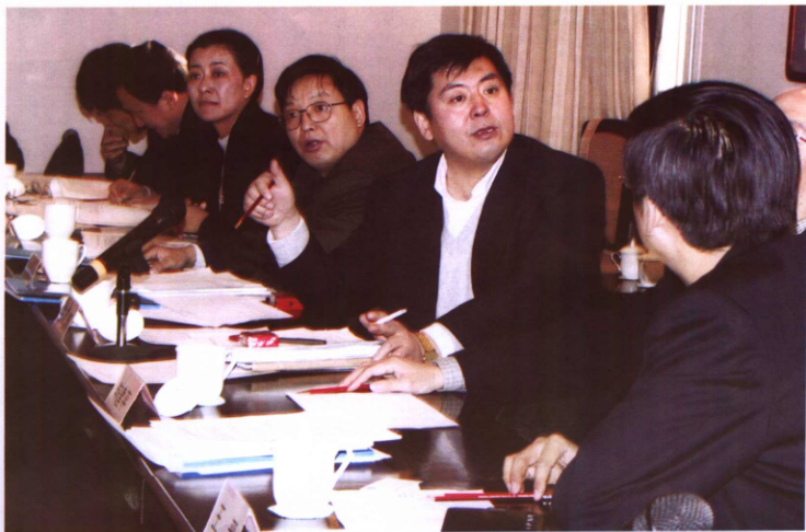
评审委员会的专家们就检察建议的一些问题展开热烈讨论。