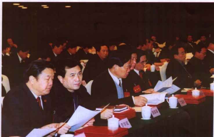
参加第十一次全国检察工作会议的各省级检察院检察长认真阅读《关于全国检察机关首届预防职务犯罪优秀检察建议评选结果的通报》。