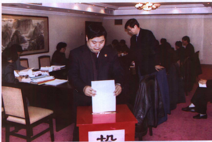
评审委员会通过投票选出优秀检察建议。