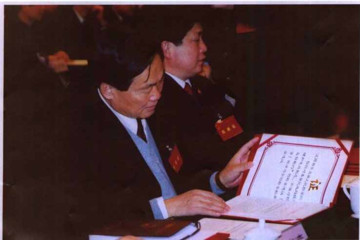
江西省人民检察院丁鑫发检察长仔细翻看获奖证书。