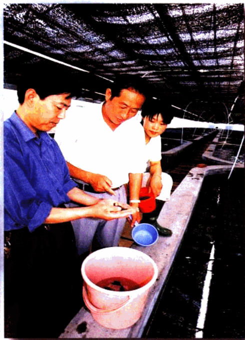
● 在观察鱼苗生长情况