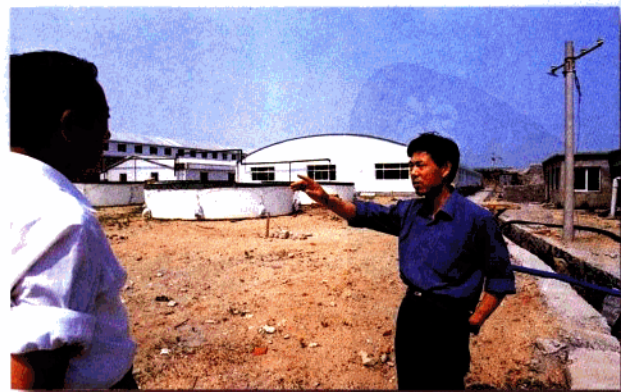
● 在日照水产研究所新址建设工地上