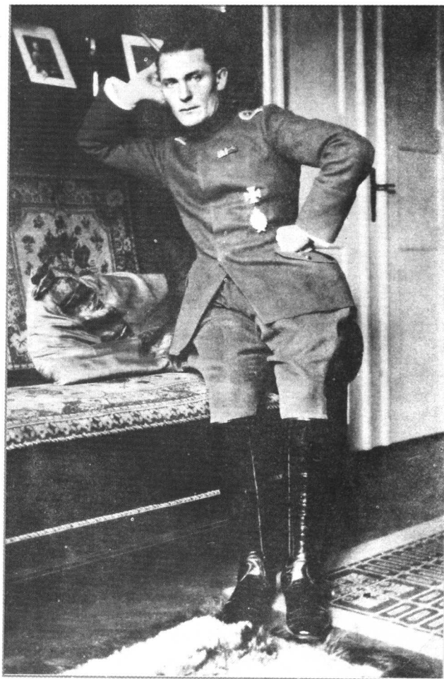
↑戈林在侦察飞行中多次立功，1915年他获得一枚铁十字一级勋章。

在当时的德国空军中，名气最大的飞行员是被称为“红男爵”的曼弗雷德·冯·里希特霍芬，以他的名字命名的飞行中队，是德国空军中战斗力最强的飞行中队。戈林尽管在德国空军中的名气也不小，但同里希特霍芬还不能并驾齐驱。到1917年11月，里希特霍芬已击落61架敌机，而戈林才击落了15架。他一直梦想