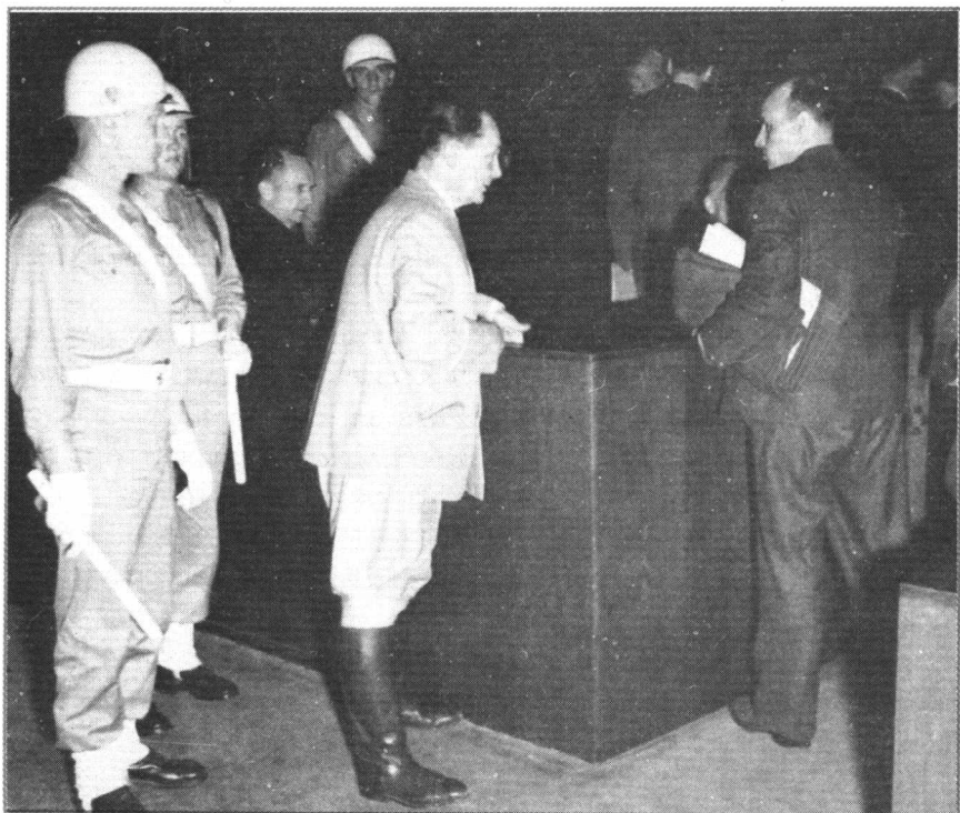
← 1945年11月20日，纳粹德国的第二号人物、帝国元帅赫尔曼·戈林被押进德国纽伦堡国际军事法庭受审。