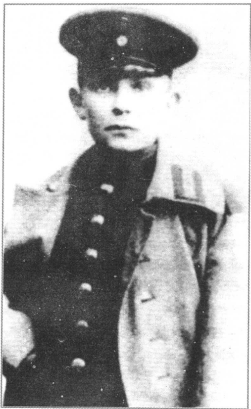
↑ 柏林大利希菲尔德军官学校学员戈林。

戈林的胆略和才华不久便引起了军界上层人物的注意，同时也为他创造了同高级官员接触的机会。他的相册里有霍亨索伦王子和他在武齐耶机场的合影、冯·克诺贝尔斯多夫将军同他和勒歌泽的合影，以及他同其他显贵的合影照片。2月的最后两天，戈林中尉分别把侦察报告直接送到旅、军指挥部。3月的一天，戈林和勒歌泽在科特德塔的法国装甲炮群上空成功地进行了一次侦察飞行，这次侦察的结