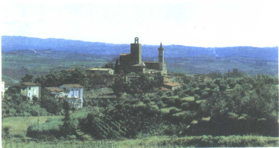
达·芬奇出生在阿尔班诺山丘下的芬奇镇

1452年4月15日，夜，这是个不平凡的夜晚，22时30分，伴随着“哇”的一声，一个漂亮的婴儿来到了人世间，降生地是意大利佛罗伦萨托斯卡省(Tuscan)郊区的芬奇镇(Vinci)安奇阿诺村(Anchiano)，谁也没有想到就是这个婴孩，日后会成为文艺复兴盛期的艺术巨匠，天才中的天才。之所以能对这个550多年前的孩子的出生日期准确到时和分，这完全得益于60多年前德国的一位学者，是他在1939年发现了孩子祖父安东尼奥·达·芬奇去世后遗失的笔记本，它实际上是安东尼奥父亲的公证簿，上面提及了他的出生与受洗，“1452年：我的孙儿，我儿皮耶罗·达·芬奇之子，生于4月15日，星期六，夜间10时30分，取名列奥纳多”，这就是几十年后其名字辉耀了那个伟大时代的艺术巨匠列奥纳多·达·芬奇。出席他受洗仪式的5男5女以及一位牧师也都被详细列出姓名，牧师是皮埃罗·第·巴尔托罗美奥·第·帕格涅卡，只是对孩子的母亲却只字不提，她的名字也没有出现在孩子的出生证上，受洗地点是圣克罗奇教堂。