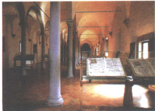
柯西莫图书馆一隅，达·芬奇曾在此研读拉丁语

1452年达·芬奇诞生后的几个月后，皮耶罗·达·芬奇与另一个女子结了婚，新娘是门当户对的公证人之女，16岁的艾比拉·德·乔万尼·阿玛多利。列奥那多出生后，母亲卡特丽娜或许就住在达·芬奇家不远的地方，在一年到一年半里一直照顾着幼儿达·芬奇。1456年，卡特丽娜嫁给绰号叫“争吵者”的烧石灰的工人安东尼奥·第·皮耶罗·第·安德雷·第·乔万尼·布