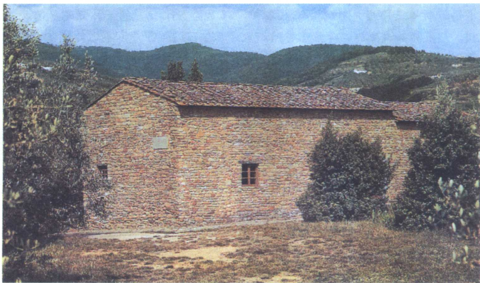
天才画家达·芬奇出生的黄色石屋

人所共知，这个婴孩是个私生子，他的父亲塞尔·皮耶罗·达·芬奇是当地一位殷实有名的律师，在佛罗伦萨也有一系列业务，对于他来说，这个非婚生的儿子，其实是他的长子，他没想到偏偏就是这个私生的长子，日后会成为他家族的永远的骄傲。此时，他知道他的祖母曾受到国王的宠信，这是他父亲告诉他的；他也知道他早晚都将是佛罗伦萨大行会的会员和世袭公证人，因为他有世袭的权利；但他绝不会知道将会有4个妻子和12个孩子加入到他77岁的一生中，而且最后一个孩子在他去世前2年出生。他的家族是当地最富裕最有影响力的家族，早自13世纪起便世居于芬奇镇，14世纪中叶，芬奇家族便以芬奇镇地名为姓，这是从皮耶罗的曾曾祖父开始的，他是公证人塞尔·米切勒·达·芬奇；曾祖父塞尔·奎杜·达·芬奇也是公证人；祖父公证人塞尔·皮耶罗·达·芬奇，娶了一位著名公证人的女儿卢西亚·德·佐塞·德·巴切