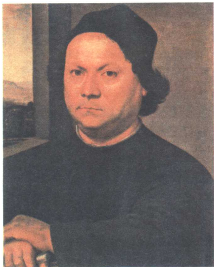
达·芬奇的老师委罗基奥地利像

有资料说，一次他在山中迷了路，走进了一个山洞里，突然，他的内心升起两种情感：害怕与渴望。是不是正是这两种感受隐隐统领了他的一生呢？是不是由于害怕生命的暗淡无奇和事业的漆黑无望，他才马不停蹄奔波于不同的城市，甚至远走国外？是不是为了渴望了解宇宙间所有的奥秘，他才去孜孜不倦于各种知识的探索和实验呢？