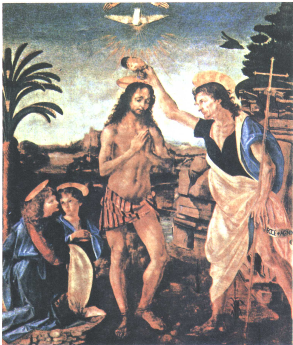
委罗基奥与达·芬奇合绘 基督受洗 1472—1475年 蛋彩、油彩画板 177 × 151cm 佛罗伦萨乌菲齐美术馆藏