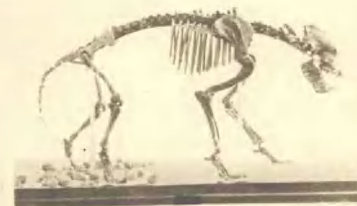
下：中国猿人化石产地的葛氏斑鹿角