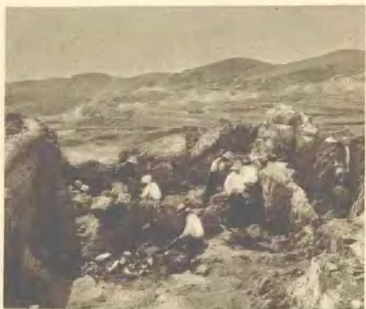
⑩ 第15地点：发现有多量的石器和哺乳动物化石 地质时代：中更新世末期；文化时代：旧石器时代初期 前一阶段