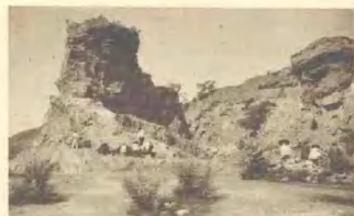
⑨ 第4地点的发掘情形：发现有哺乳动物化石和几件不典型的石器 地质时代：中更新世末期；文化时代：稍晚于第15地点