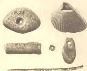
山顶洞人的骨针及装饰品