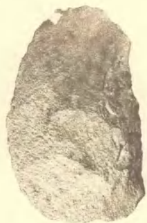
由第15地点发现的石器