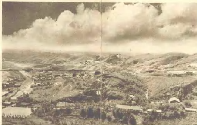
中国猿人化石产地鸟瞰图