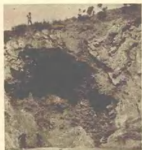
⑧ 第3地点：发现有大量的动物化石，时代与第4地点相同