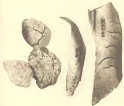
中国猿人用火的证据——烧骨和烧石