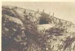
⑦ 山顶洞：发现新类型的人类遗骸、石器、骨器、装饰品及大批的动物化石 地质时代：上更新世末期；文化时代：旧石器时代晚期 上：发掘情形 下：原来的洞口