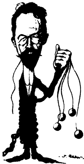
契诃夫漫画像——法国雷东绘

注：维也纳，威尼斯等地教堂里的管风琴演奏，给契诃夫留下深刻印象。1891年3月24日他在威尼斯给弟弟写信说：“当你站在教堂里倾听管风琴的奏鸣，真想皈依天主教。”