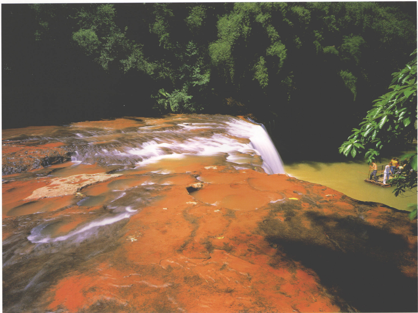
色彩交响曲 Color Symphony 色の交響曲 칼라교향곡