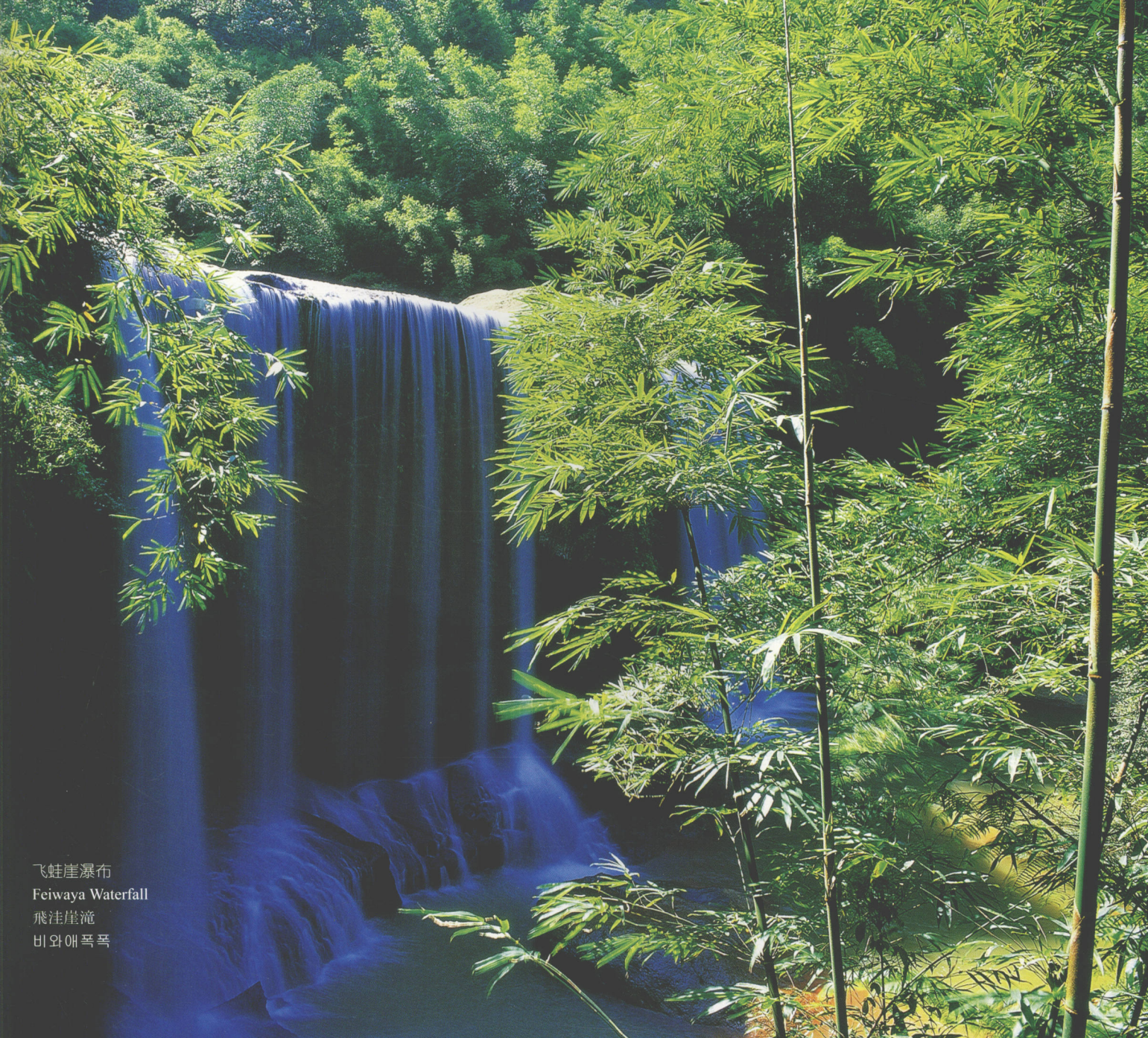
飞蛙崖瀑布 Feiwaya Waterfall 飛蛙崖滝 비와애폭폭