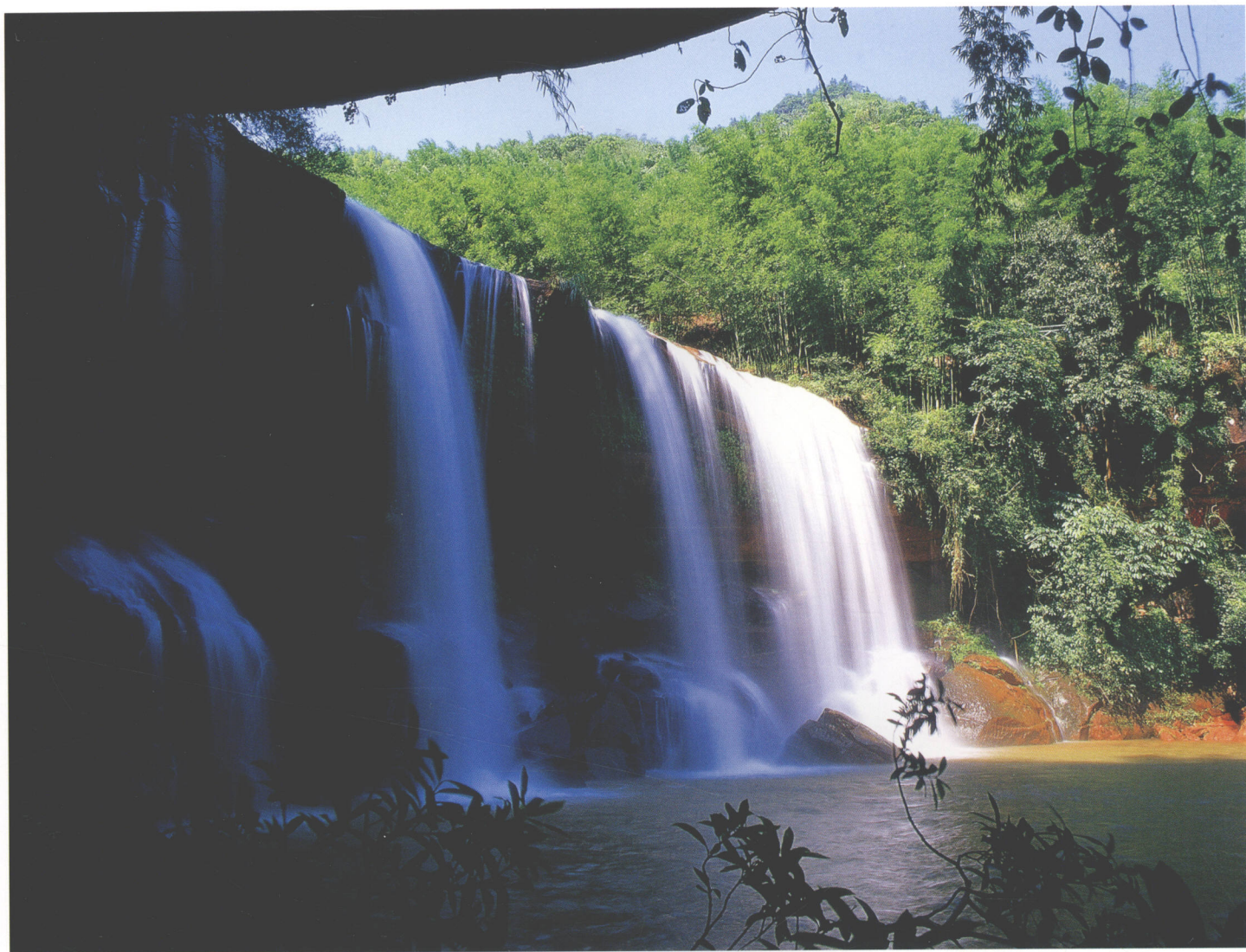
水帘洞瀑布 Water Curtain Cave Waterfall 水カーテン滝 수렴동폭포