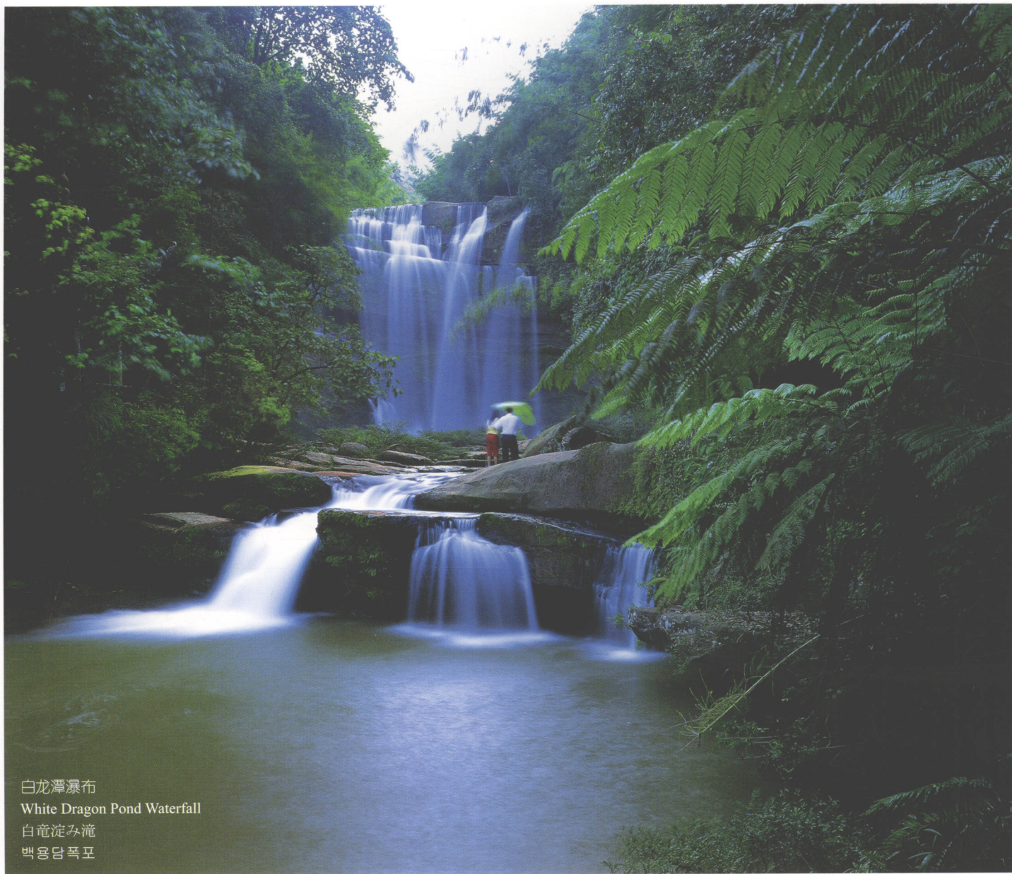
白龙潭瀑布 White Dragon Pond Waterfall 白竜淀み滝 백용담폭포