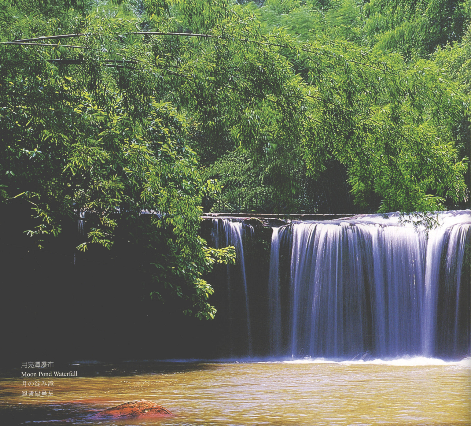
月亮潭瀑布 Moon Pond Waterfall 月の淀み滝 월광담폭포