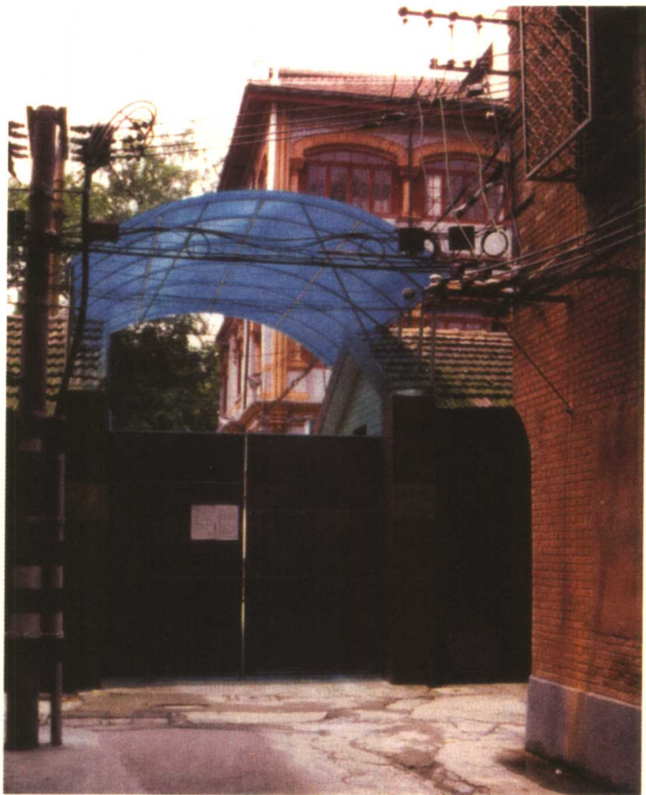
◇ 弄堂里的 漂亮小学