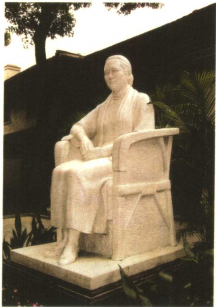
◇ 宋庆龄故居纪念馆前的宋庆龄塑像

的赤诚，以及不满足于事物的表面而要寻根究底的兴趣。在美国读大学时，她考虑的已经是 中国所发生的革命事件更为深刻的意义了。在她美丽娴雅而略带忧郁的外表下，她的内心深处已经是一名义无反顾的叛逆者。而此时，她的大姐霭龄正在继续致力培养自己驾驭金钱的精明强干的手段；大弟子文正在哈佛大学的经