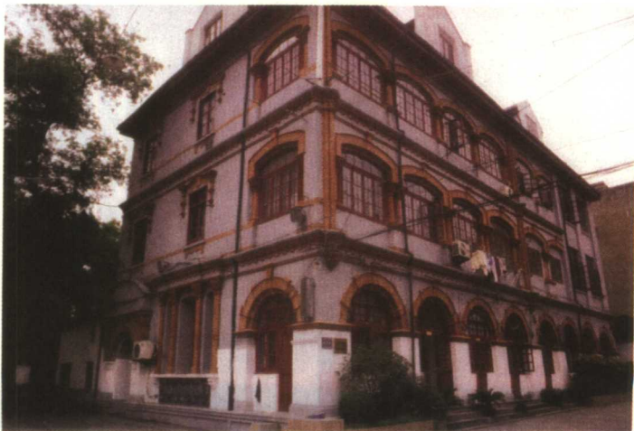
◇ 九十多年前的 孙中山行馆