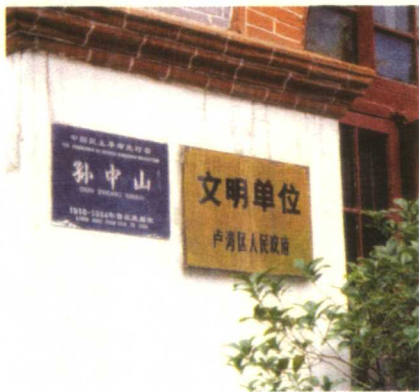
◇ 孙中山曾在此居住

然而，所有的幻想迅速破灭。1913年初，袁世凯撕毁《临时约法》，图谋复辟称帝。7月，孙中山在上海对袁公开谴责：“其敢自称帝者，全国共讨之。”就是在这幢房子里，他再次上路，开