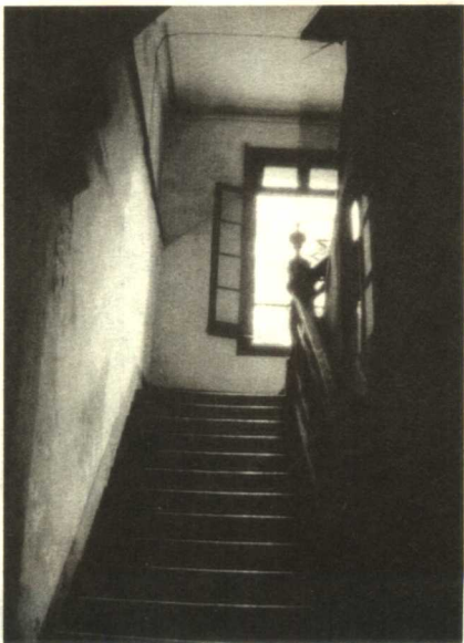
◇ 楼内很窄的扶梯，木头已经很旧了