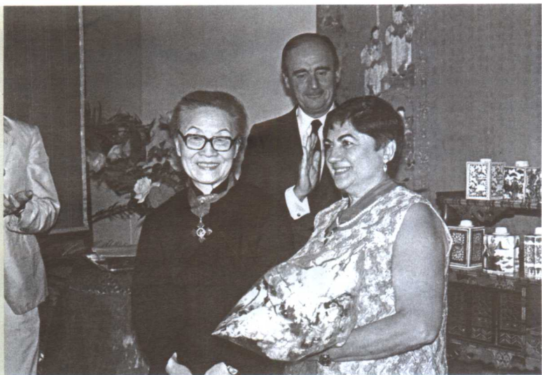
1986年10月6日，在西班牙驻华大使馆接受国王颁给的“智慧国王阿方索十世十字勋章”后与大使合影