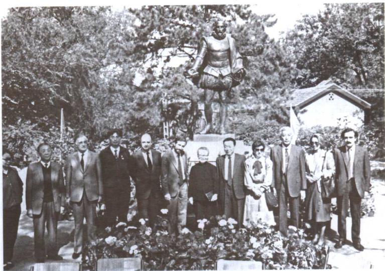
1986年10月，马德里市长送塞万提斯复制像到北京大学校园落户