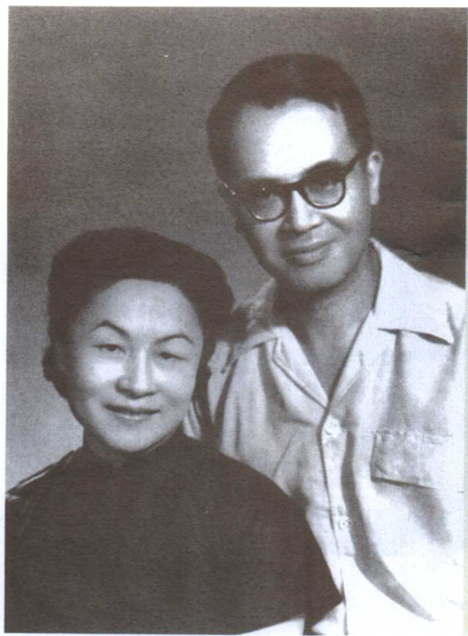
摄于1962年，时正开始由原文翻译《堂吉诃德》