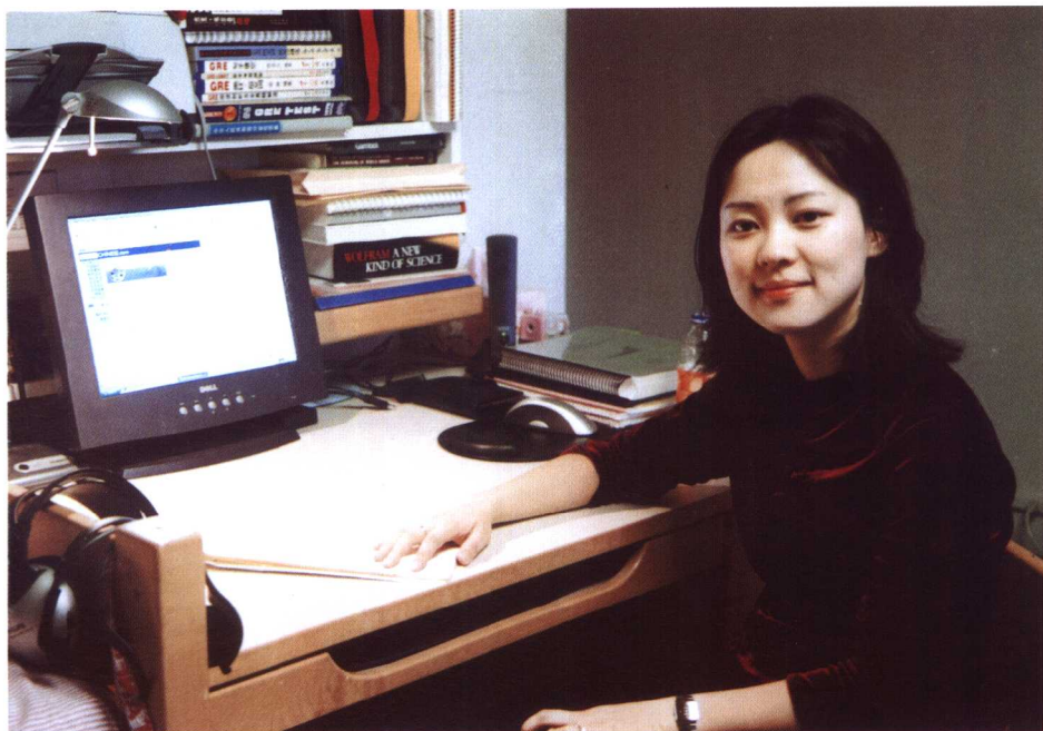
2002年秋，述在斯坦福大学宿舍