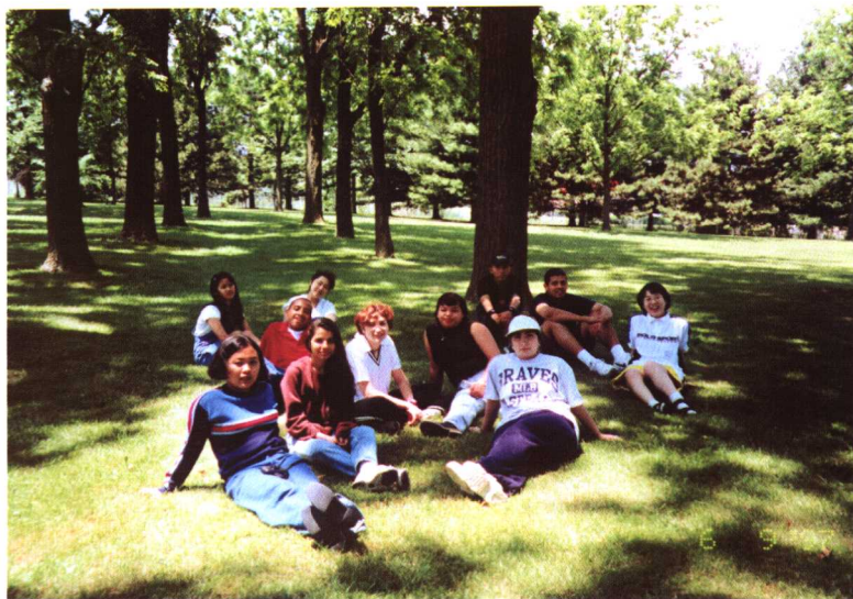
ESI 的朋友们在这 的学校背后 Thomas Johnson 博物馆 (老十九世界庄园 留影)