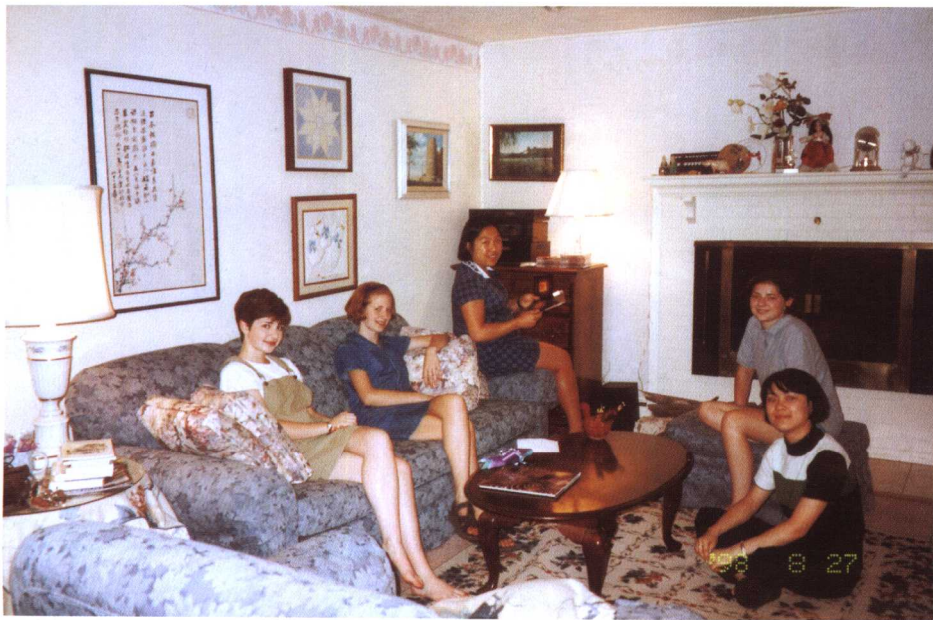
述和她的朋友在家里的客厅聊天