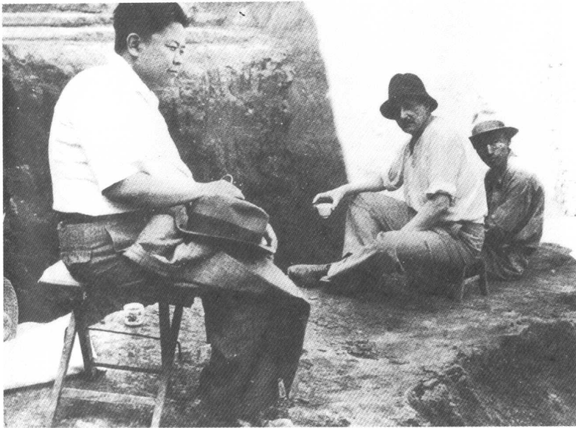
1935年，傅斯年与梁思永（右一）、法国汉学家伯希和（右二）在安阳第十一次发掘现场合影。