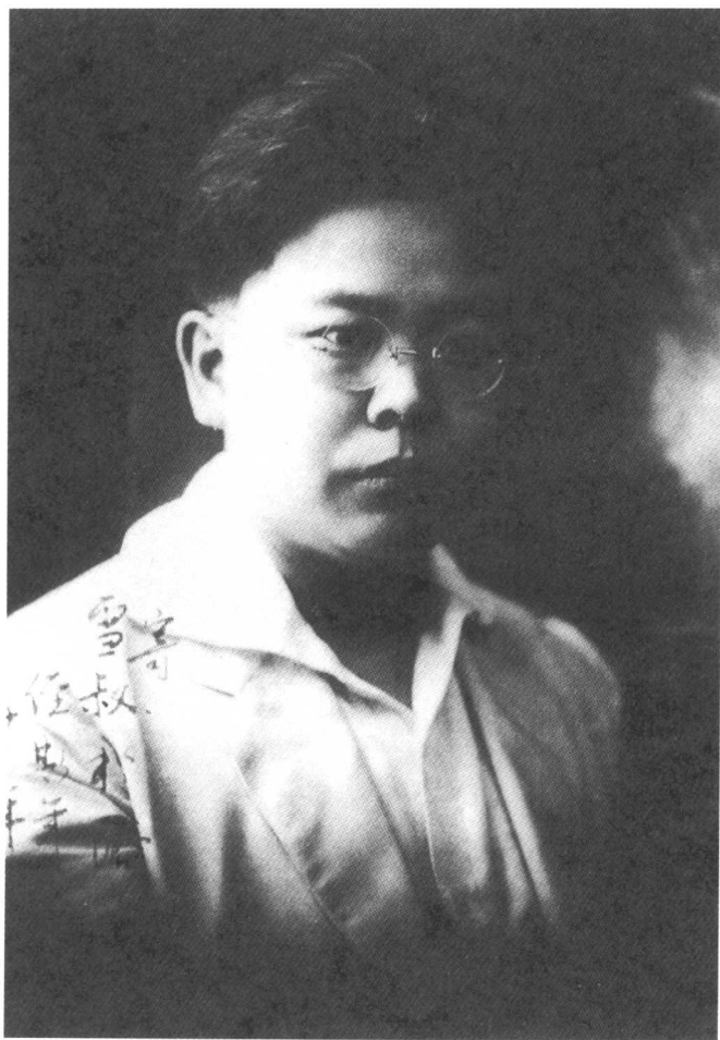
1927年，傅斯年先生在广州时留影。