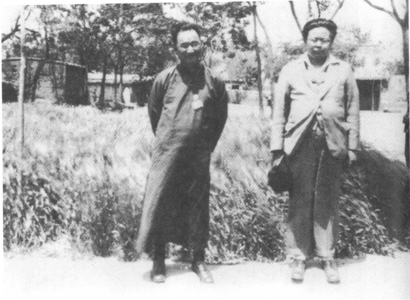
1931年，傅斯年与李济在河南安阳洹上村小屯殷墟发掘工作站前合影。