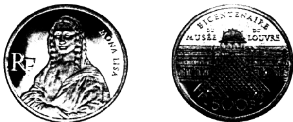
图 1-2 1993年,法国发行的500法郎鲁佛尔博物馆200周年纪念金币

前有著名华裔建筑师贝聿铭设计的金字塔状玻璃建筑。将稀世名画如实地复制在一枚小小的硬币上,真有一钱在握,爱不释手之感。该币在美国钱币协会加州夏季展评会上获“1993年度硬币奖”。又如1995年俄国为庆祝第二次世界大战胜利50周年发行的100卢布纪念银币(图1-3),币上绘出第二次世界大战后期的3次历史性会议:德黑兰会议、雅尔塔会议和波茨坦会议及同盟国三巨头:斯大林、罗斯福和丘吉尔。会议期间英、美领袖更迭。英国改为艾德礼,美国改为杜鲁门,故共有5位领袖像。反面是在克里姆林宫和圣巴西尔教堂前为庆祝1945年5月9日第二次世界大战胜利纪念日(V-E日)的焰火和探照灯的夜景。这枚直径为10.3厘米,厚1.3厘米,重1千克的巨大银币由俄国莫斯科制币厂制造,不啻一座国际比赛的锦标银盾。其艺术价值远远超过它本身的币值。据说,斯大林出现在苏联和俄国的硬币上,这还是第一次。为此,俄国当局在决定制造该币前曾争议达9个月之久*。