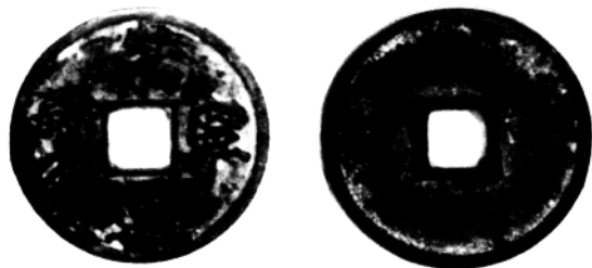
图 1-1 中国北宋铸造的“崇宁通宝”