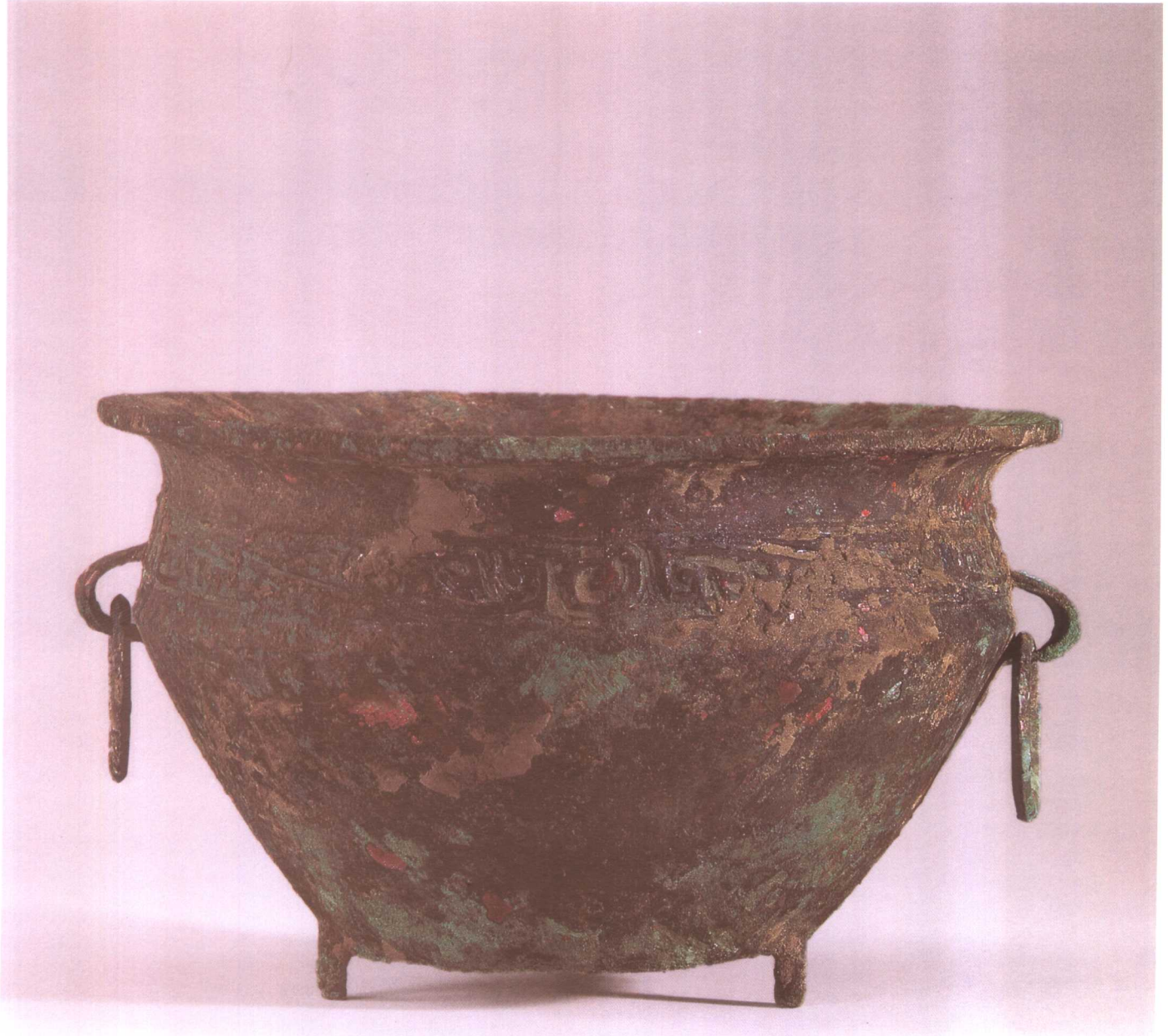
三三八 斜角雲紋盆