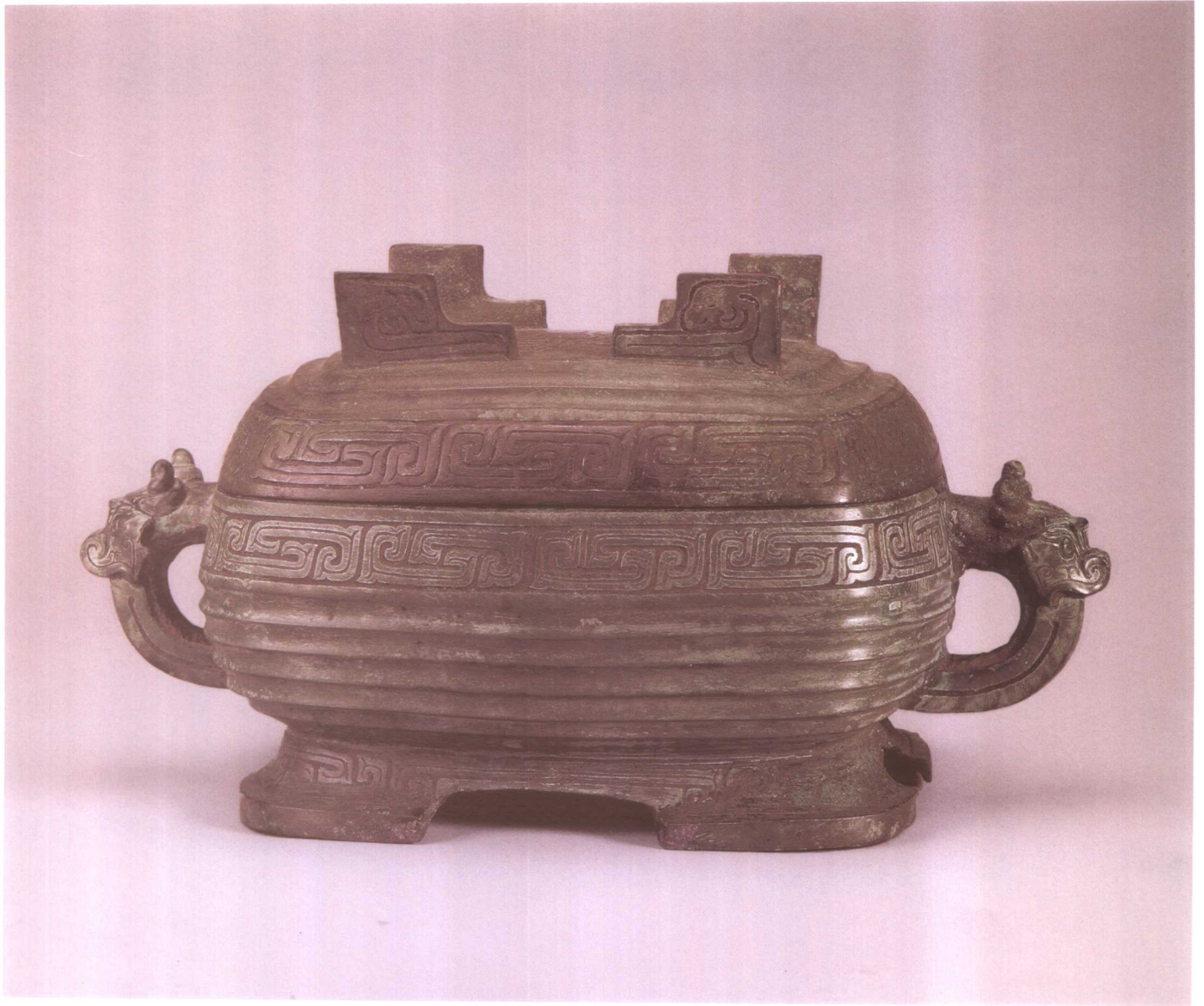
三三六 趙叔吉父盨 (一)