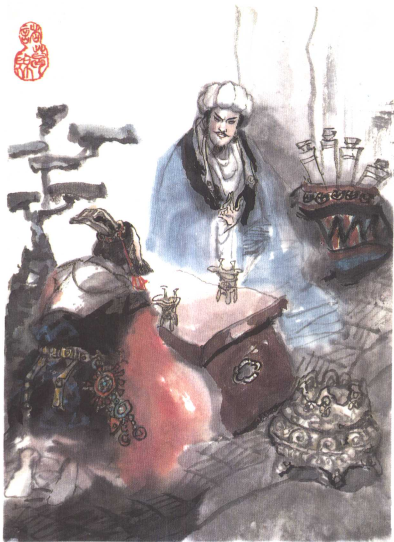
隆中对 (P 344)