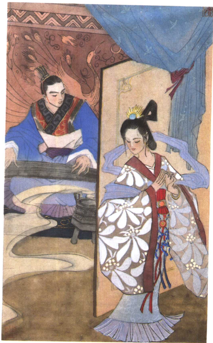
行吟泽畔 (P 95)