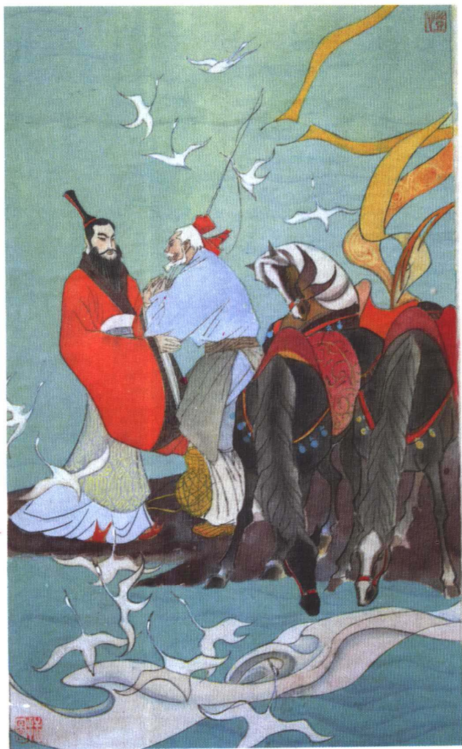
垂钓渭阳 (P 31)