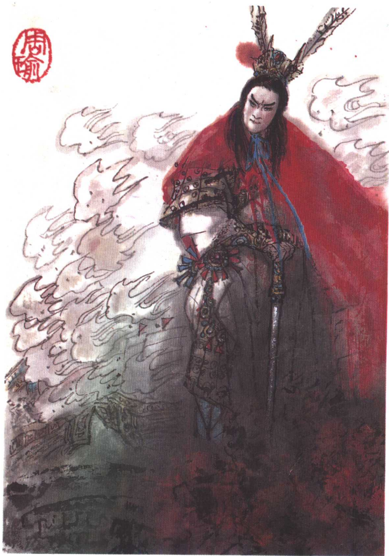
取胜赤壁 (P 387)