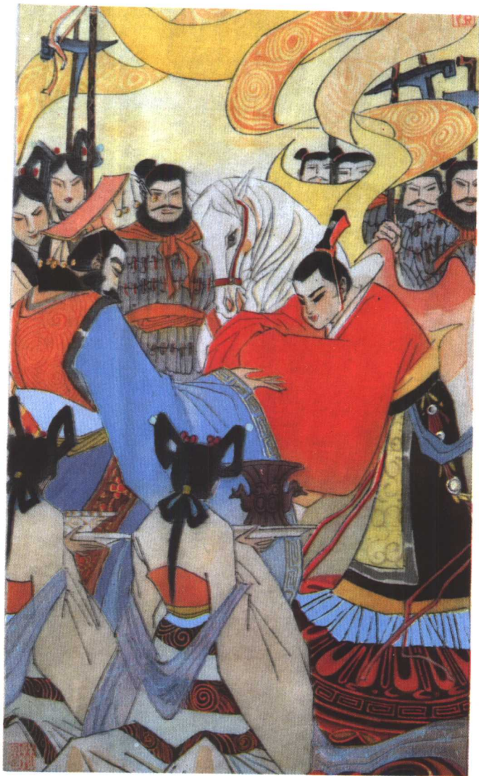
十二为上卿 (P 72)