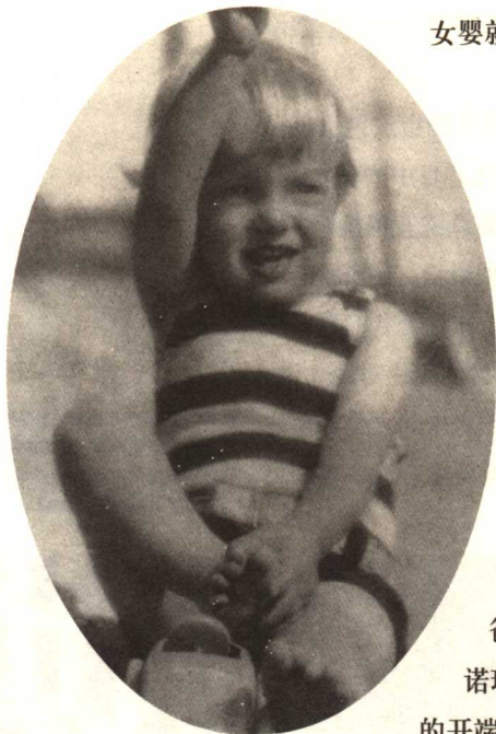
▲玛丽莲·梦露六个月时的照片。她1926年6月1日出生于洛杉矶，原名诺玛·琼·贝克。