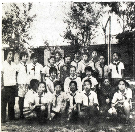
冰心与儿童（一九七九年）