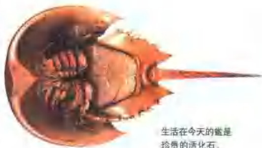
生活在今天的鲎是珍贵的活化石。