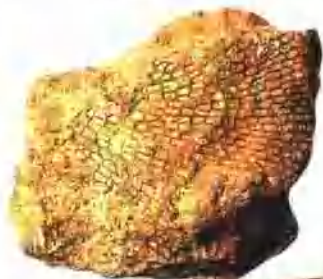
布满小格的小窗格苔藓虫化石。