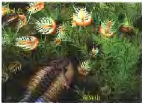
奇异虫与狮头虫生活想像图。

奇异虫头部宽阔，尾部较小，有呈圆锥状变小的长胸部和随着成长增加的节。它们的眼睛很发达，侧面颊延长为壳针，眉间的前部裂片呈扁平状。