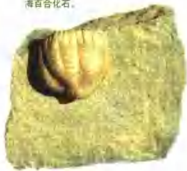
如同花朵的海百合化石。

别看海百合外貌出众，它的本性却异常凶残。它的嘴长在花心底部，所以这朵美丽的“百合花”只不过是开在它嘴上的一个“陷阱”罢了。不仅如此，它的萼巴周围还生长着羽毛般的细枝，构成了捕食的网，误入“歧途”的虫子，很少有能逃走的。