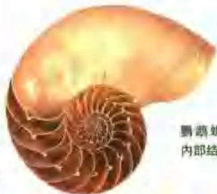
鹦鹉螺壳的内部结构图。