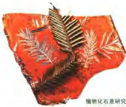
植物化石是研究植物进化的重要依据。

化石是保存在古老岩层中的生物遗体或生物活动所留下的遗迹的统称。由生物遗体本身变成的化石叫做遗体化石，由生物的遗迹变成的化石叫做遗迹化石。