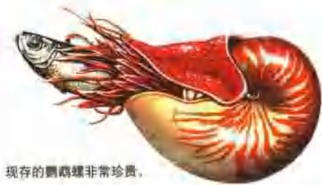
现存的鹦鹉螺非常珍贵。