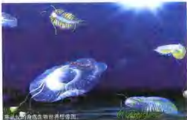
寒武纪的海洋生物世界想像图。

就让我们一边阅览千姿百态的古生物，一边探索古生物王国的秘密，从而更加珍爱生活在我们周围的一切生命。现在让我们一同进入神奇的古生物世界。