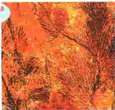
树笔石化石真像树枝。

树笔石胞管有正胞管、副胞管和茎胞管3种。其中，正胞管像直管，具有发育能力的茎。树笔石底端的表皮组织已演变为根状构造，借以固着生活。