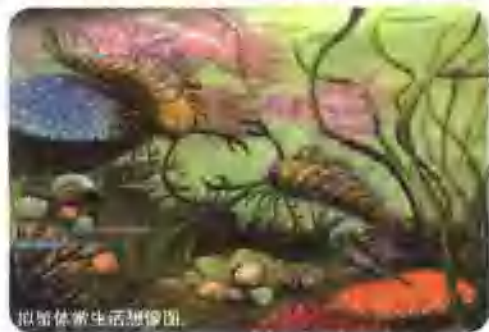
拟蟹体鲎生活想像图。

拟蟹体鲎有和蝎状生物相似的身体，它的头甲是方形的，有6对附肢。12节体节和末梢的尖壳针与头甲连接在一起。它的头甲的下面有6对附肢，分工也有所不同：第1对生长着螯，第2至第5对用于行走，第6对呈鳍状。