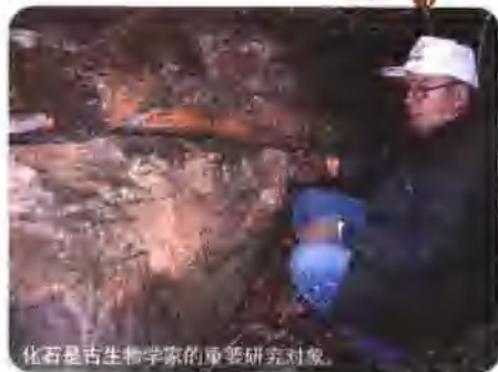
化石是古生物学家的重要研究对象。