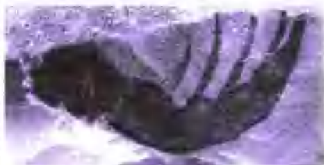
拟蟹体鲎化石残片。

拟蟹体鲎又称钱币虫，属于板足鲎目板足鲎科。拟蟹体鲎的化石最早出现在志留纪，它的化石在欧洲、北美洲等地分布较多。拟蟹体鲎最早生活在海洋中，后来逐渐向含盐量较低的水域过渡，最后生活在淡水中。