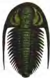
繁衍生息了3.5亿年的三叶虫。

过去的地球，到处都留下了古生物的身影，有落地生根的植物，有来去自由的动物，还有行踪诡秘的微生物。大的如侏罗纪的恐龙和巨杉，小的如菌类，长寿的生命达数千年，短命的甚至只有几分钟……丰富多彩的古生物综观起来真让人不可思议。