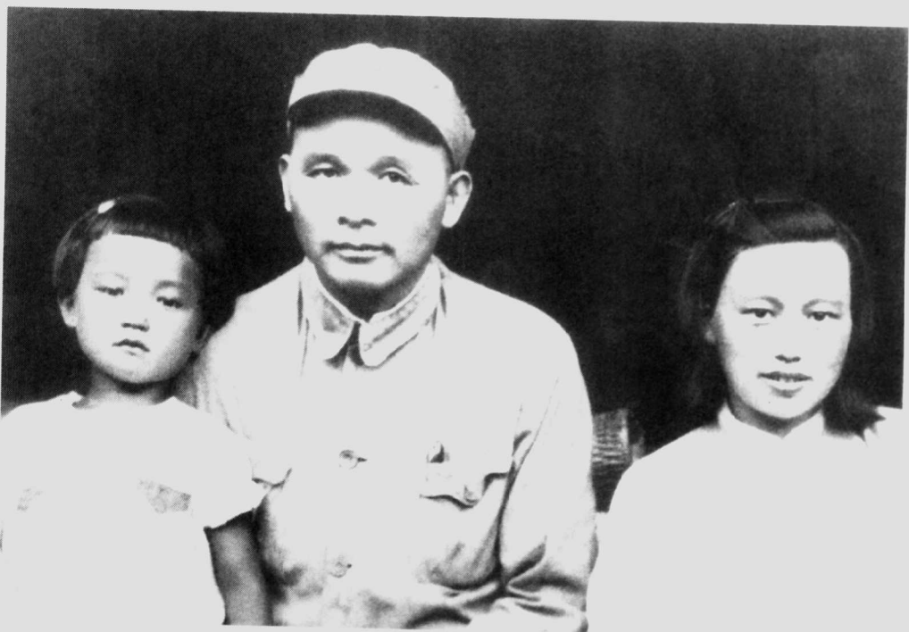
徐海东同夫人周东屏及女儿在一起。