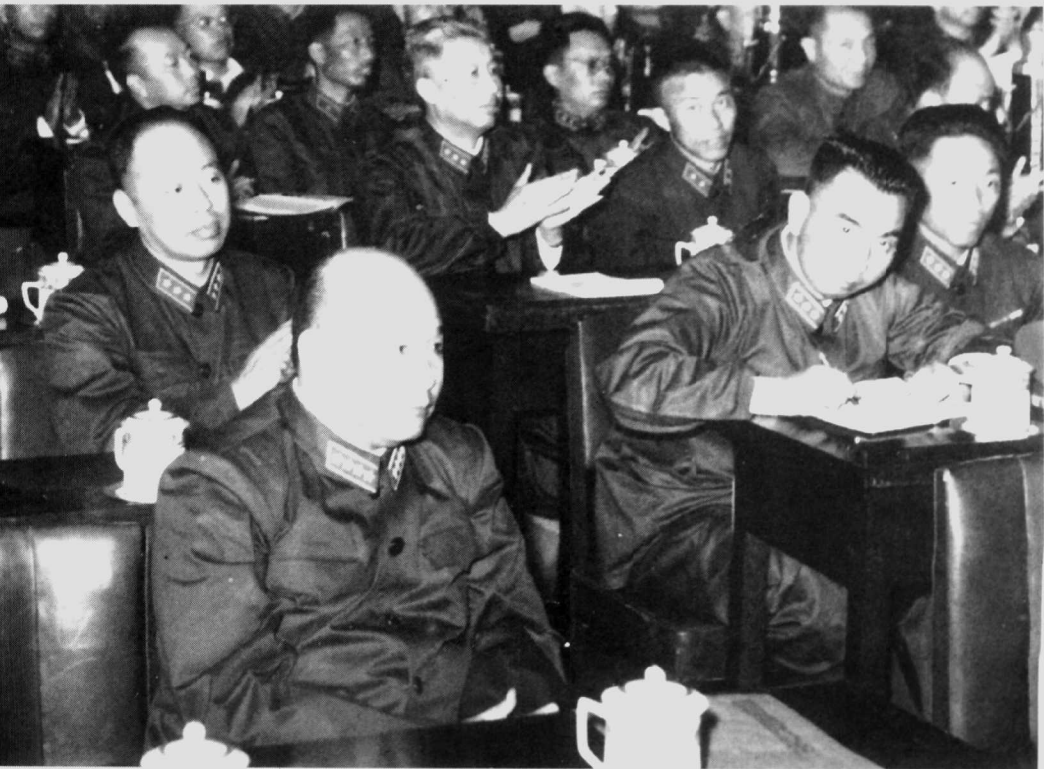
1958年5月，徐海东(前)在军委扩大会议上。