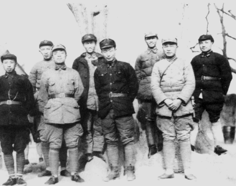
1936年2月,红1军团、红15军团部分领导干部在陕西淳化县。左起:王首道、罗瑞卿、杨尚昆、程子华、聂荣臻、陈光、徐海东、邓小平。