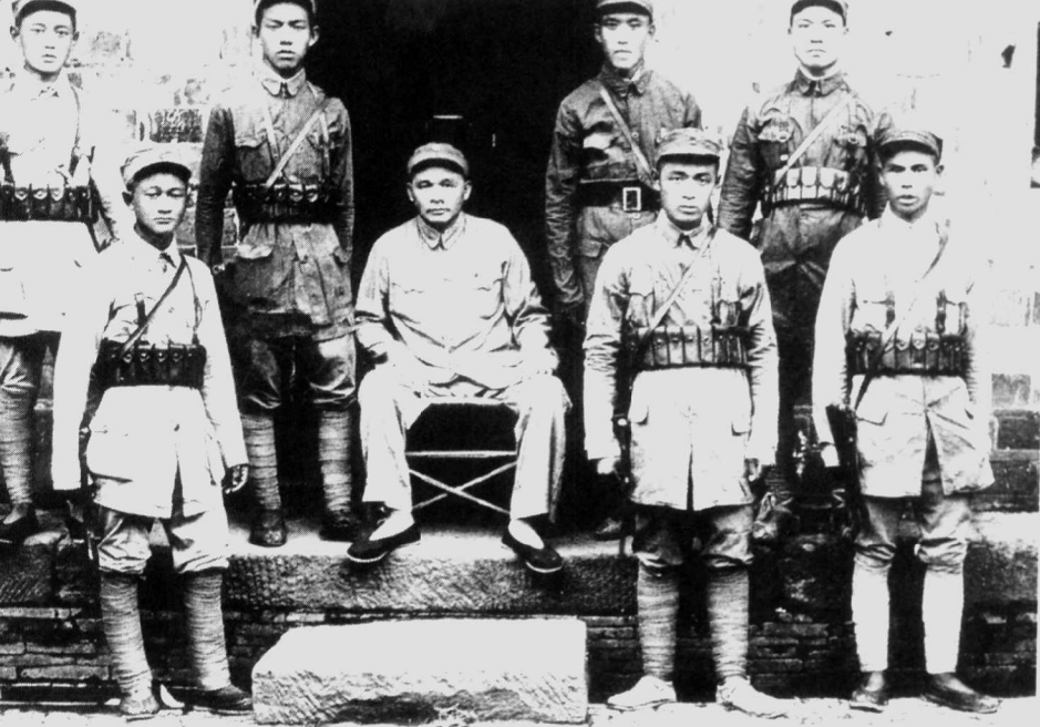
1941年，徐海东(中坐者)同警卫战士在一起。