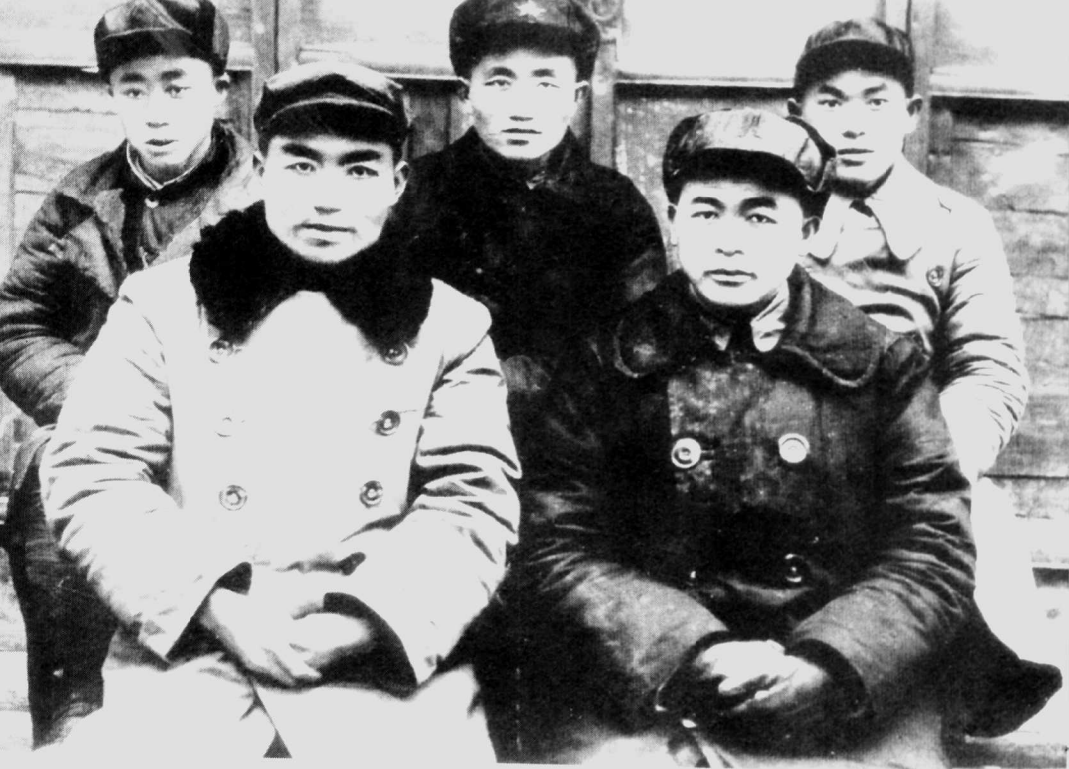
1937年,徐海东等在延安合影。左起:李隆贵、郑位三、程子华、徐海东、陈先瑞。