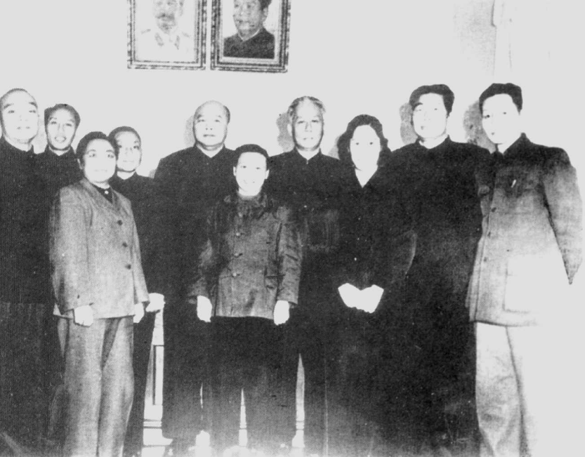
1955年，徐海东夫妇同刘少奇夫妇、邓小平夫妇及杨尚昆等在沈阳军区大连第一疗养院合影。左一为杨尚昆、左四为邓小平、左五为徐海东、左七为刘少奇。