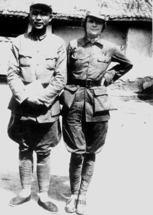
徐海东在延安会见美国记者海伦·弗斯特·斯诺(尼姆·威尔斯)。