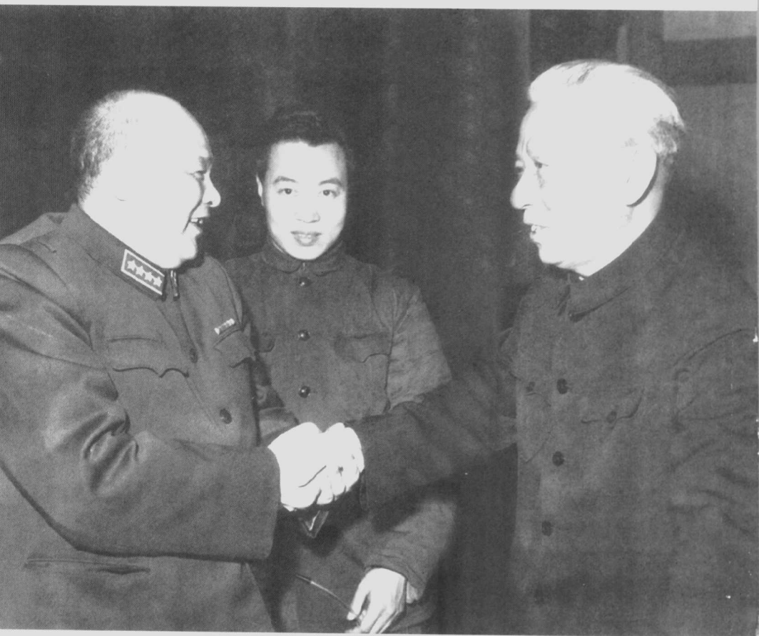
1965年,徐海东(左)出席国防委员会会议时,同刘少奇(右)握手。