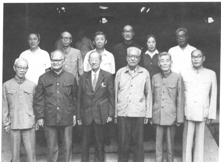
1981年赵元任接受北大荣誉证书后和与会专家合影留念 左起前排：吕叔湘、王力、赵元任、岑麒祥、周祖谟、蒋南翔 后排：林焘、李荣、朱德熙、张龙翔、王光美、梅益