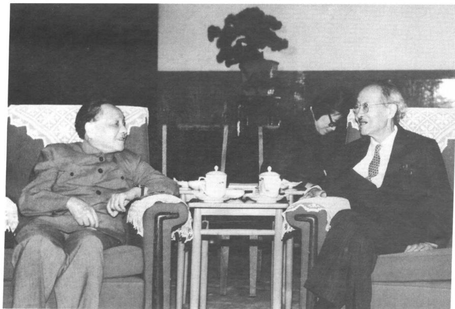
(上) 1973年周恩来在人民大会堂热情会见赵元任 (下) 1981年邓小平在人民大会堂与赵元任亲切交谈