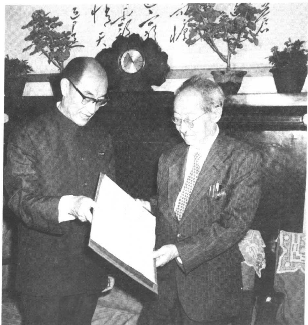
1981年北京大学 校长张龙翔授予 赵元任名誉教授 证书