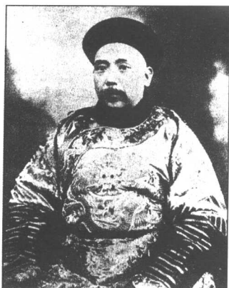
深受朝廷重用的袁世凯。1899年12月被任命为山东巡抚

1月4日,大学士、军机大臣王文韶代表清政府向英国驻华公使窦纳乐表示对卜克斯被杀一事的“深切忧虑”。当日,清廷就卜克斯事件发布上谕,表示要“严缉凶犯”,惩办失职官吏,保护教士。5日,窦纳乐派驻沪副领事甘伯乐赴济南,参加处理卜克斯被害事件。