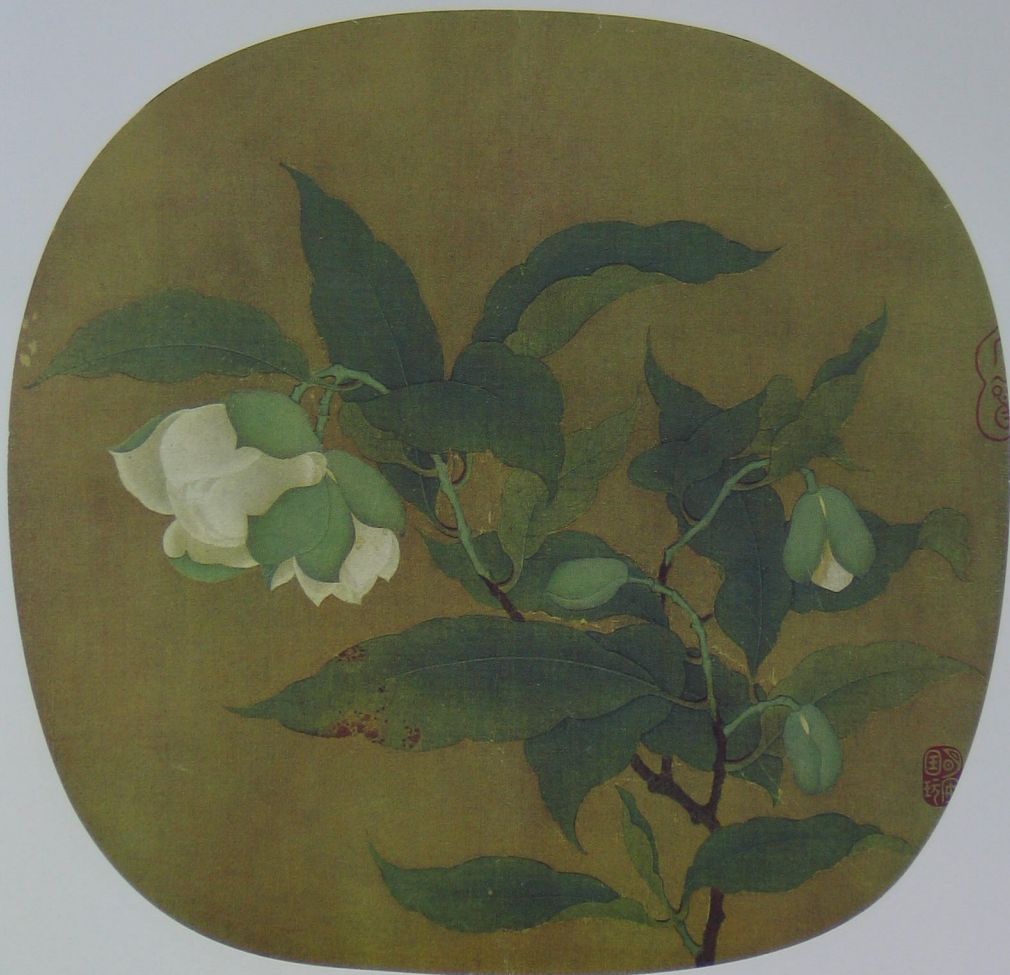
夜百合图 宋 无款 绢本 设色 纵二四·五厘米 横二五·五厘米

此幅作品从风格面目上看，是南宋初期画院的作品。双勾设色，造型精致，结构严谨，线条飘逸流畅。尤其是其线条金勾铁画、细劲而富于变化，给人们以精致异常的感觉，设色浓丽而不耀目，显出生动而富贵的情趣。