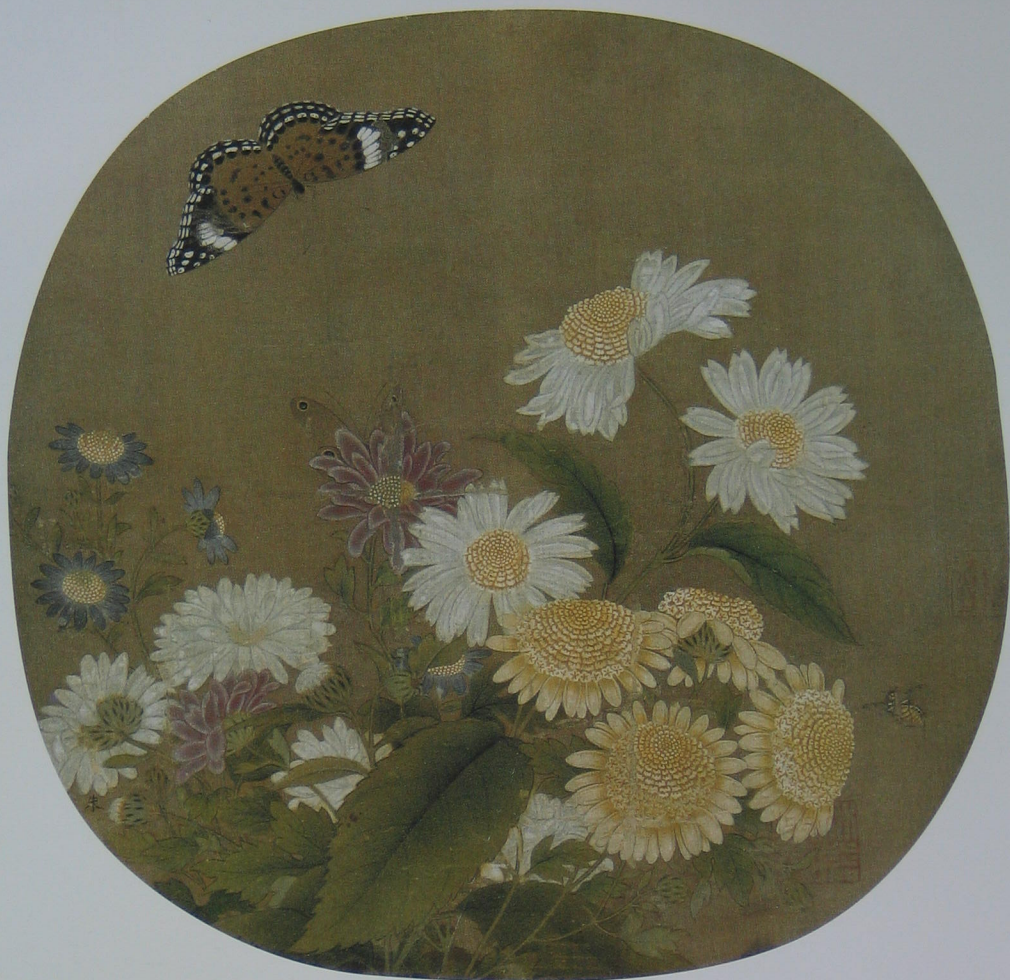
丛菊飞蝶图 宋 朱绍宗 绢本 设色 纵二三·七厘米 横二四·五厘米

此图系绢本，原为纨扇，内容丰富，设色艳丽，是宋代画家朱绍宗的作品。作品描写了繁复的菊丛，几种大小不同、颜色各异的菊花组成了一组富贵而绚丽的画面，似开未开的花朵点缀其间，丰富而有变化，一飞一停两只蝴蝶增加了画面的动感，而画面右下部的黄蜂似乎更增加了画面的声音。