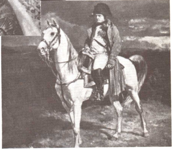
拿破崙於1814年約瑟芬死後