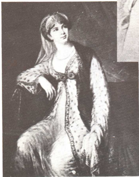
義大利名歌女喬西皮娜·格拉西尼