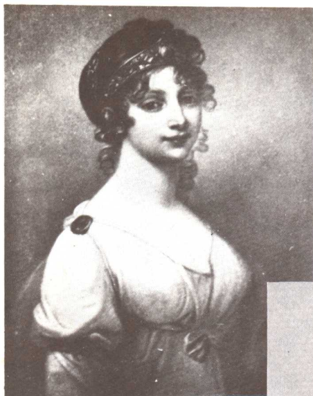
普魯士王后馬利·路易絲