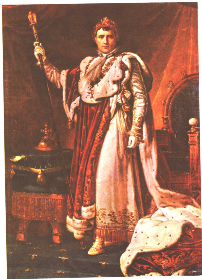
法蘭西人皇帝拿破崙