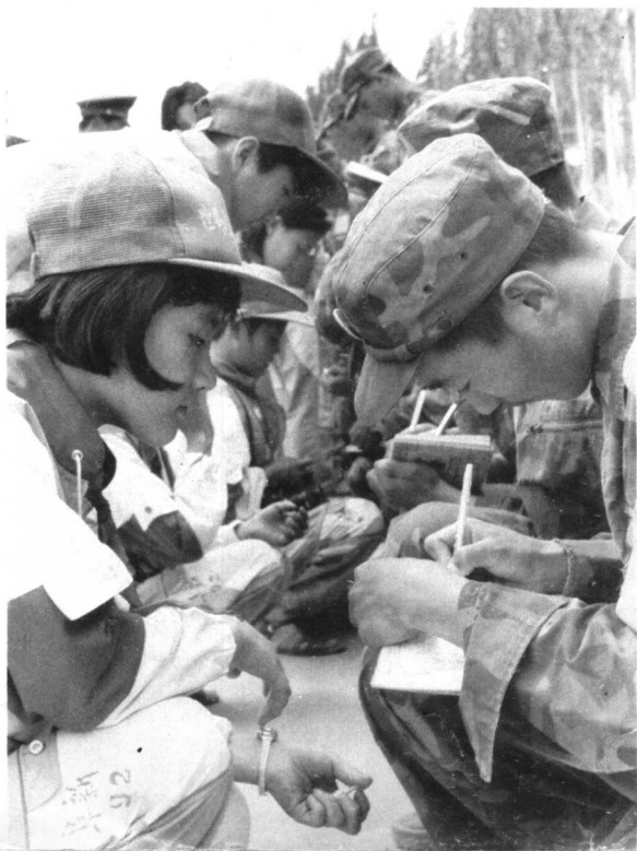
1992年7月，辽宁阜新“世界屋脊”少儿摄影创作团来到邱少云生前所在连进行军事摄影创作。临别时，小朋友们请战士留名。