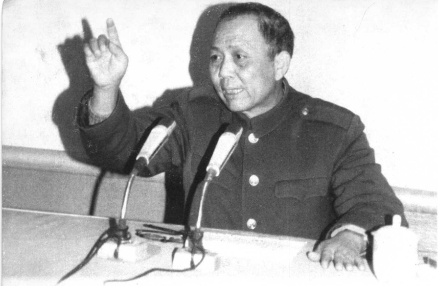
邱少云生前战友、特等功臣、二级战斗英雄林炳远给部队作传统报告。