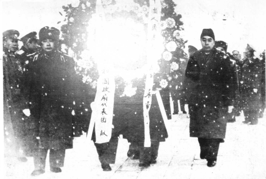
周恩来总理、陈毅副总理在朝鲜访问期间，于1958年2月17日冒雪向邱少云烈士墓敬献花圈。