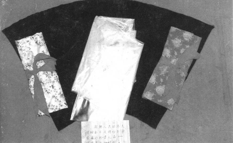
朝鮮人民的伟大領袖金日成贈給烈士親屬的珍貴禮品