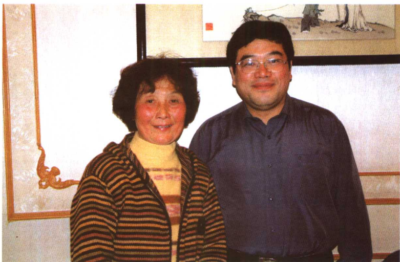
作者与中国教育学会副会长、全国劳动模范、全国三八红旗手、江苏省特级教师李吉林老师合影。