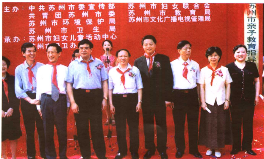
2002年六一儿童节，作者出席苏州市亲子教育指导中心落成仪式。