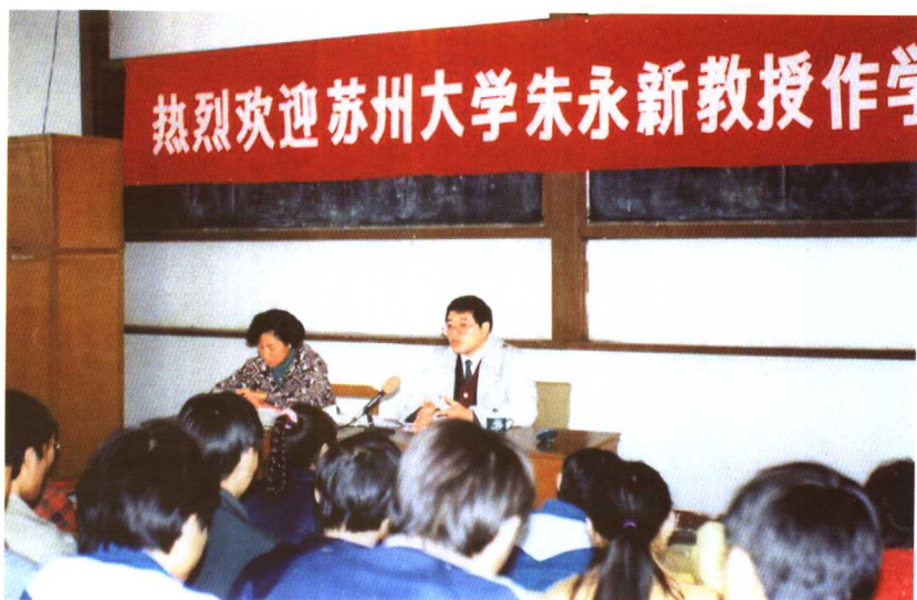
作者为中小学教师作学术报告。