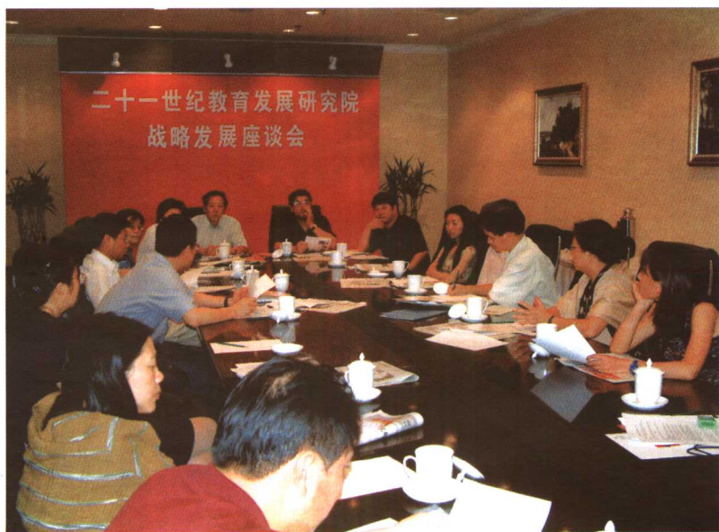
2003年8月，作者在北京出席21世纪教育发展研究院战略发展座谈会。