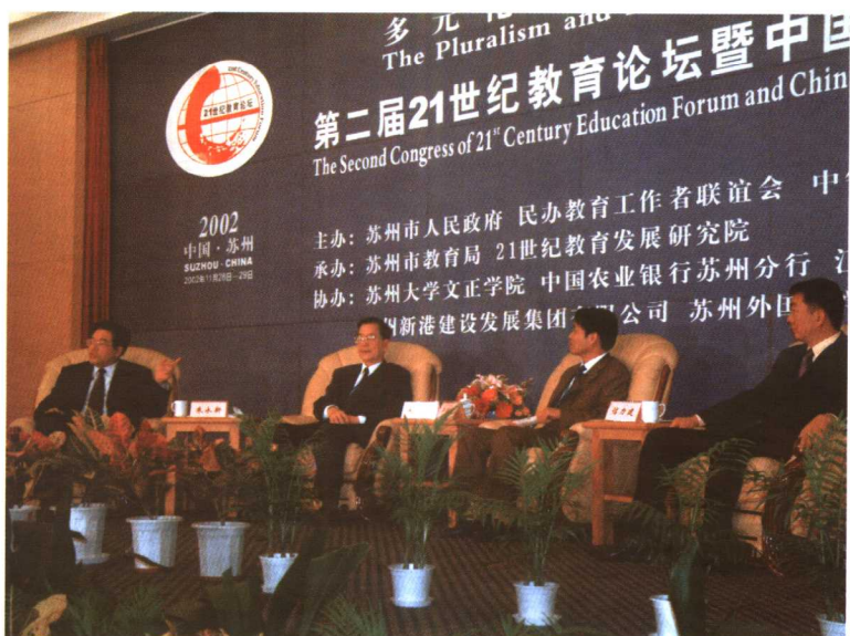
2002年11月，第二届21世纪教育论坛暨中国民办教育高峰论坛在苏州举行（左一为作者），来自全国各地近五百名代表出席了这次盛会。