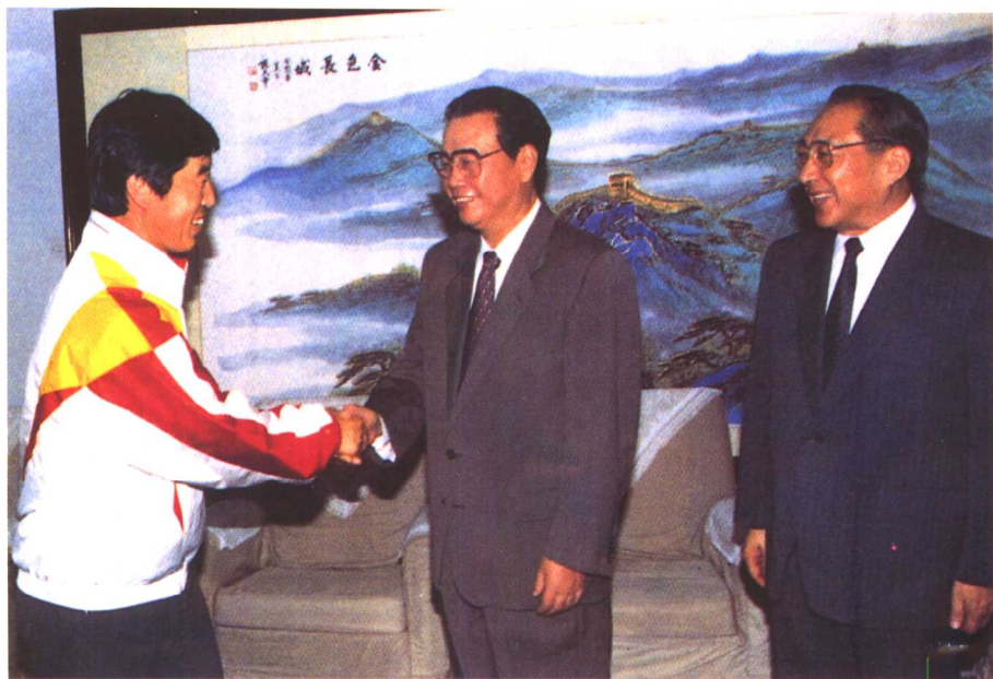
1993年9月，在北京工人体育馆，李鹏总理、李岚清副总理等亲切地会见了马俊仁等优秀教练员和运动员。