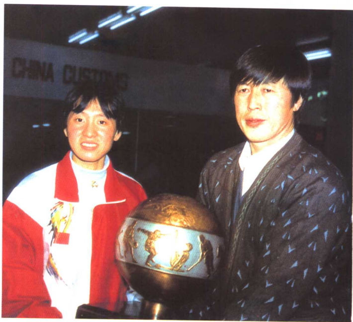
著名运动员王军霞在美国接受欧文斯奖杯后，1994年2月5日晚和教练马俊仁载誉乘飞机回到北京。图为王军霞和马俊仁教练在北京首都机场合影。