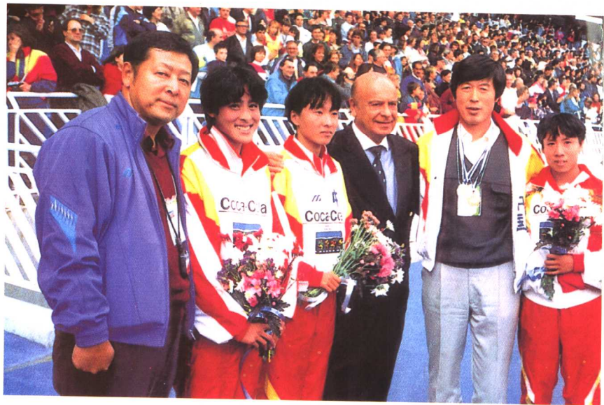
国际田联主席内比奥罗同马家军合影。