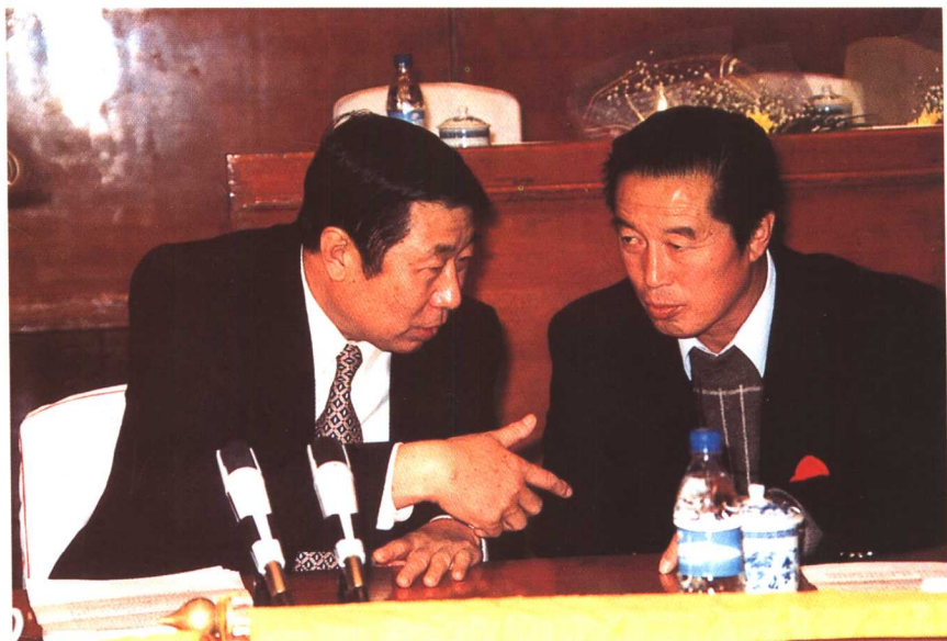
中共辽宁省委书记闻世震肯定马俊仁的成绩，鼓励他再创佳绩。