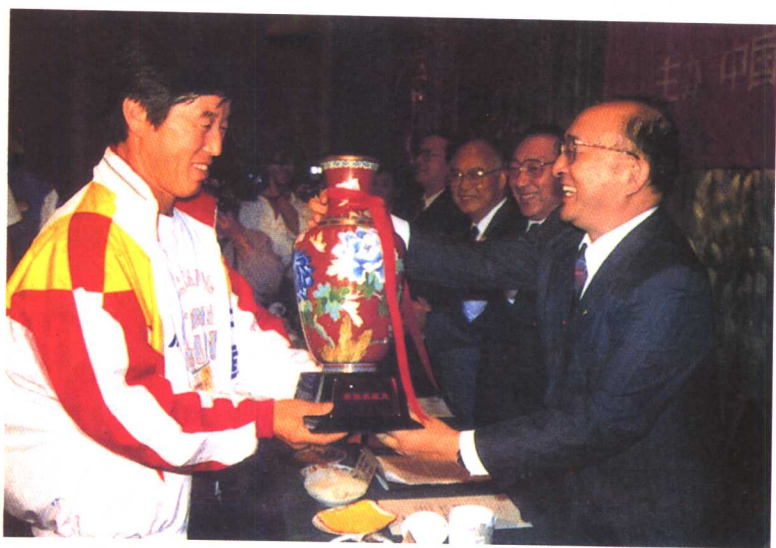
中国田径协会1993年9月13日在北京人民大会堂召开大会，表彰在七运会田径比赛中创造优异成绩的运动员和教练员。图为国家体委主任伍绍祖向马俊仁颁发优秀教练员奖。