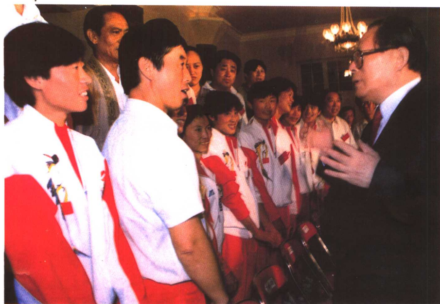
中共中央总书记、国家主席江泽民1993年8月25日在大连接见载誉归来的中国田径队时，亲切地对辽宁党政领导同志说：“辽宁运动员为国家拿了这么多金牌，立了大功，可喜可贺！”图为江泽民总书记同马俊仁教练热情地交谈。