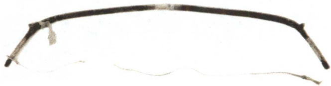
皇太极御用牛角弓