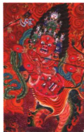
《四臂勇保护法》中心局部 布本设色唐卡 清代 西藏