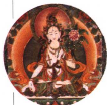
《白度母》中心局部 布绘唐卡 清代 西藏