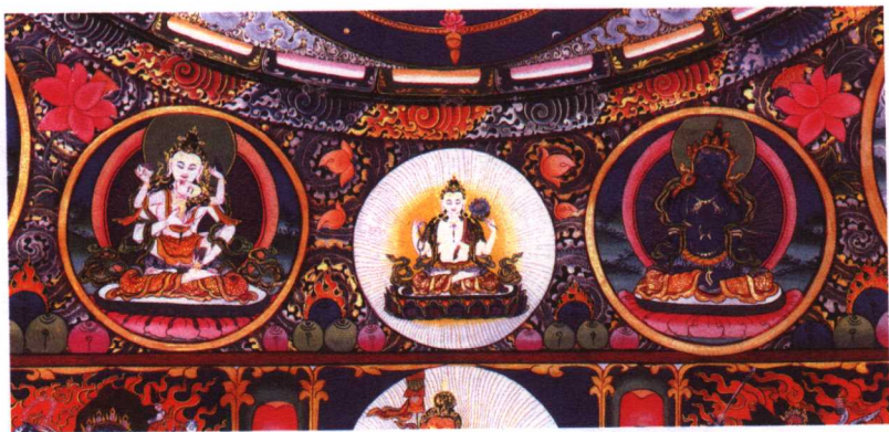
《双修金刚萨埵》下中长条局部

左为白身金刚萨埵，怀抱明妃，明妃左手执噶巴拉碗，右手执钺刀；中为白身四臂观世音，胸前两手握持摩尼宝珠，右侧手执念珠，左侧手执紫莲花；右为蓝色身虚空藏菩萨。三像间饰含芭荷花与宝物若干，上为蔓荼罗图五彩局段。