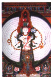
千臂观世音菩萨 布本设色唐卡 清代 西藏