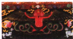
《时轮王佛》下中局部的大鹏鸟 布本设色唐卡 清代 西藏