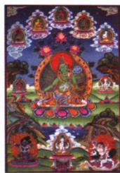
绿度母 布本设色唐卡 清代 西藏