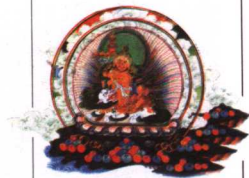
《死神阎摩转动生命之轮》下中局部财宝天王 布本设色唐卡 清代 西藏