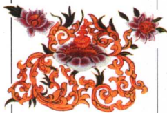
唐卡里的莲花与宝瓶