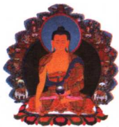
《释迦牟尼佛》中心局部 布本设色唐卡 清代 西藏