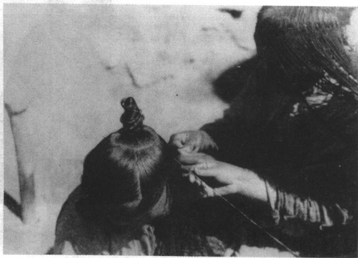
拉卜楞妇女梳头扎细辫