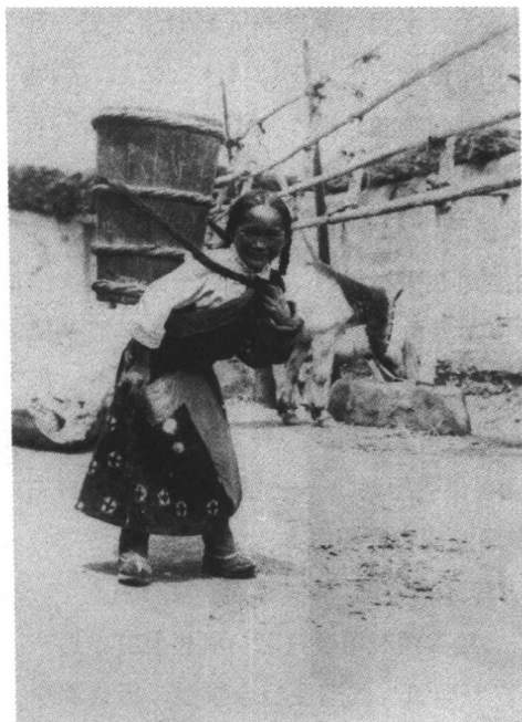
用木桶背水的姑娘