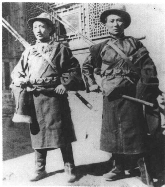
武装的拉卜楞男子