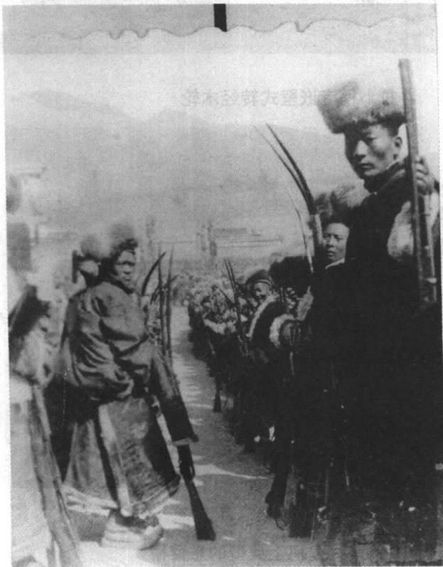
去作仪仗的武装队