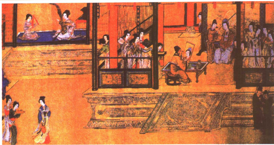
■ 汉宫春晓图局部（明 仇英）