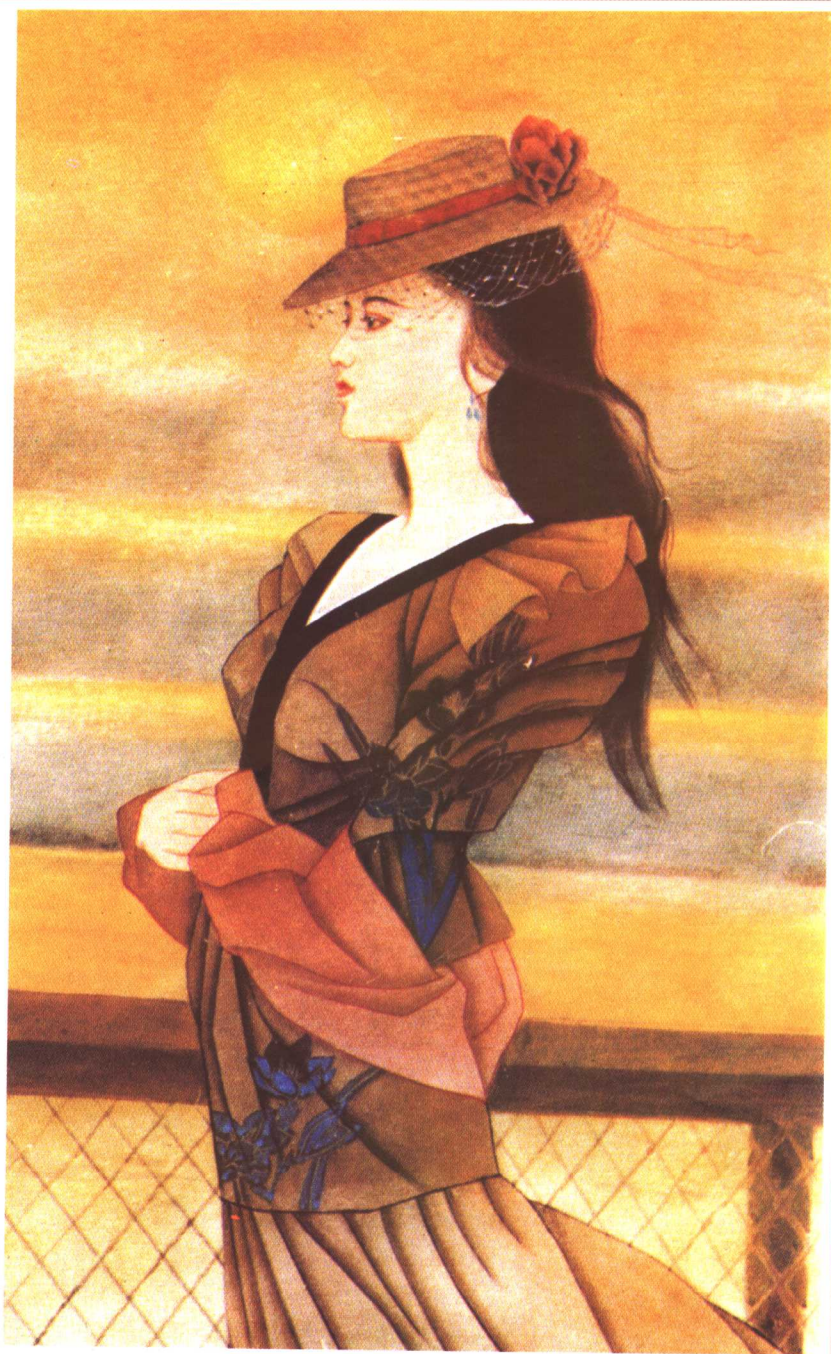
■名妓出身的著名画家潘玉良