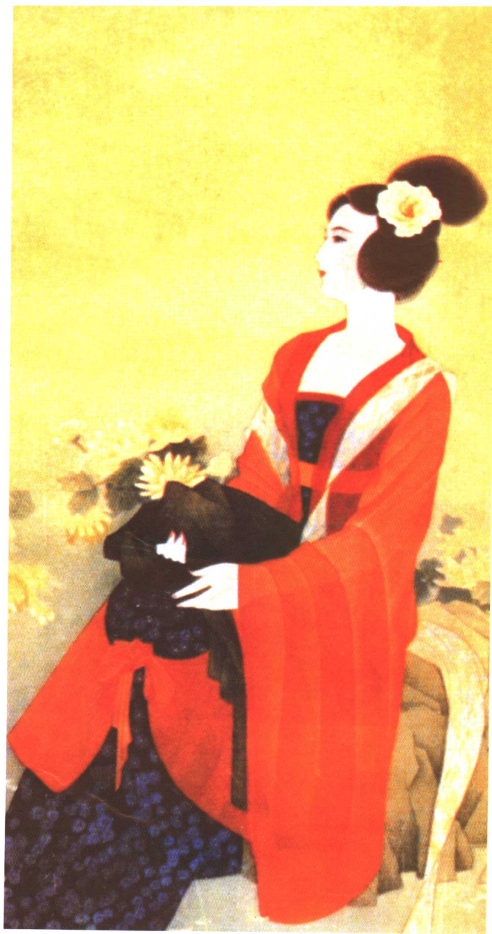
■唐传奇《李娃传》的主角李亚仙，多情而侠义。