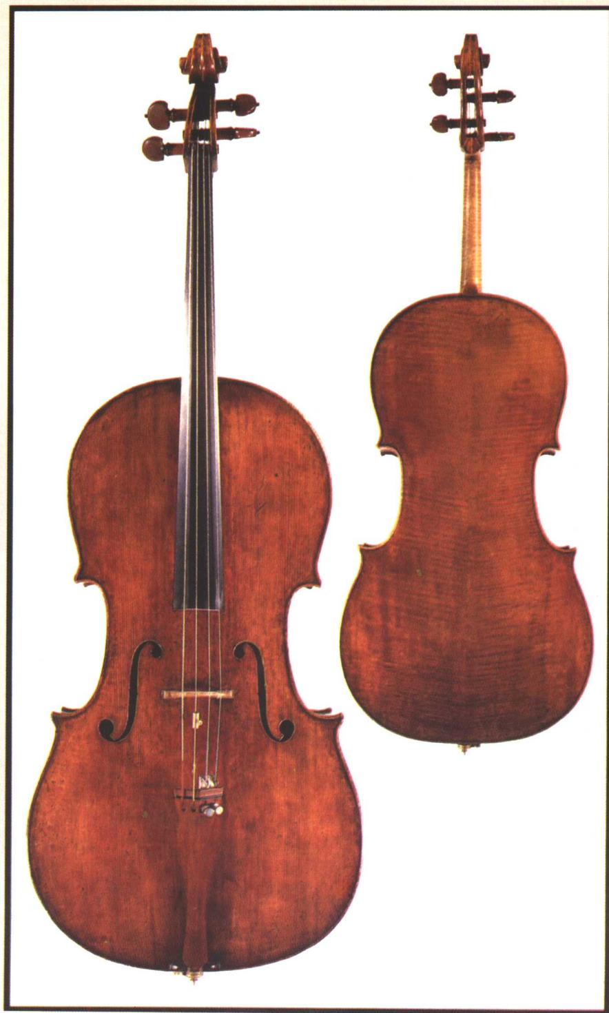
斯特拉地瓦利制作的大提琴