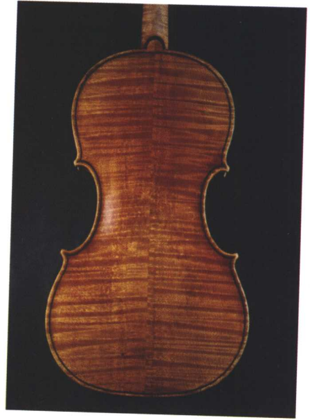
法国名琴维尔昂背面