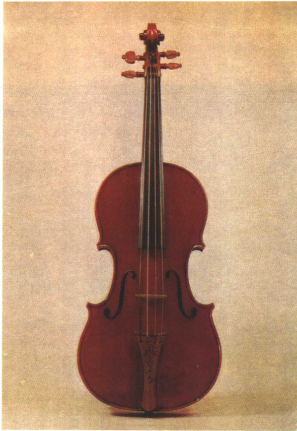
著名的斯氏名琴“弥赛亚”