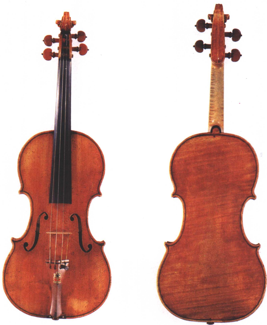
梅纽茵用过的名琴“威尔顿勋爵”