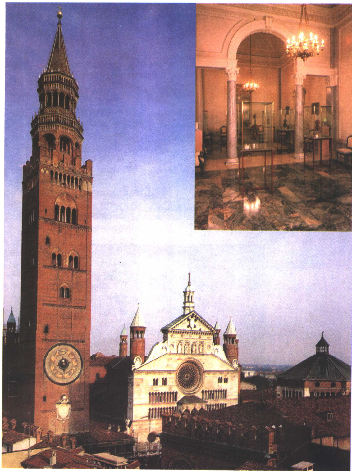
意大利格里蒙特镇及格里蒙特名琴陈列室