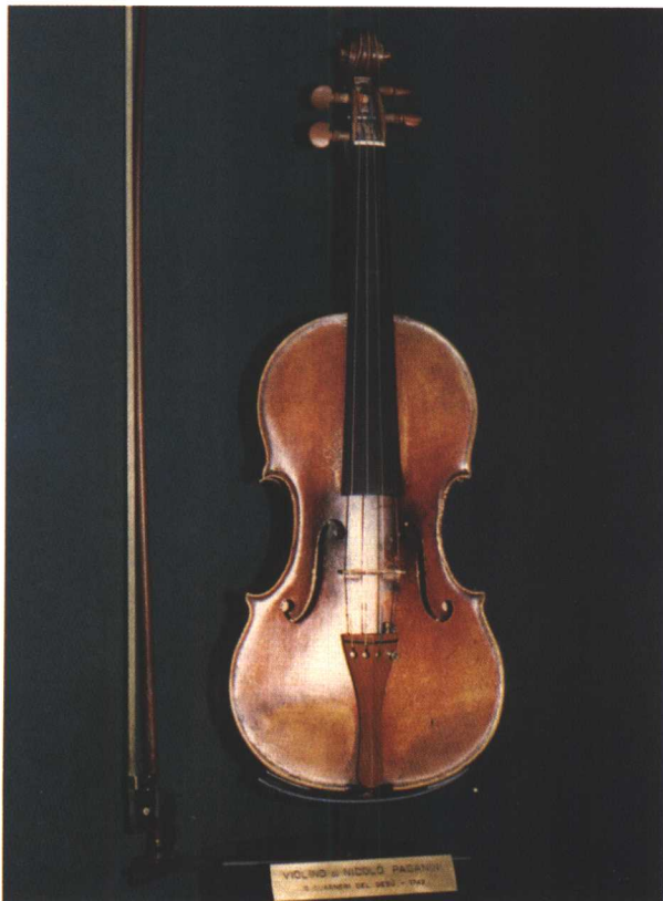
帕格尼尼用过的名琴“大炮”