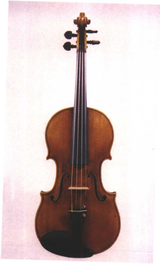
法国名琴维尔昂正面