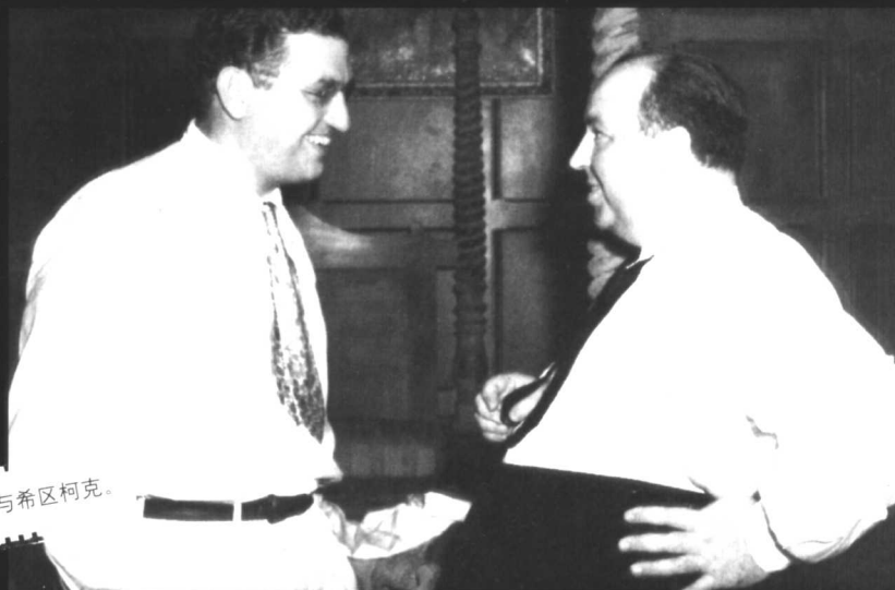
戴维·塞尔兹尼克与希区柯克。