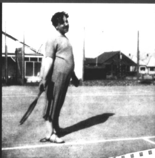
留胡子的希区柯克仍热衷于打羽毛球。（后来编剧查尔斯·贝内特埋怨说，除非球径直向他飞去，否则他一动也不愿意动。）