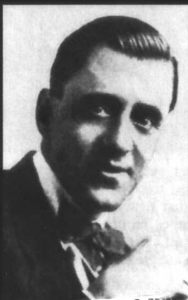
艾略特·斯坦纳德，他参与编剧的希区柯克影片超过任何其他作家。在《讹诈》之前，他为希区柯克的无声电影撰写了部分或全部的剧本。