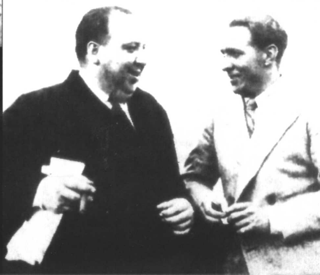
与“世界上最好的跟班”查尔斯·贝内特在一起。贝内特继斯坦纳德之后为希区柯克撰写了最多的电影剧本。从《知情太多的人》开始为他最精彩的7部影片担任编剧。