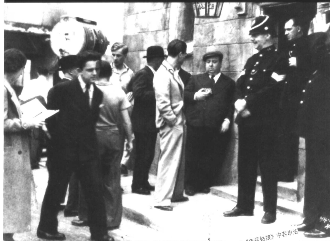
希区柯克在《年轻姑娘》中客串法庭外的新闻记者。