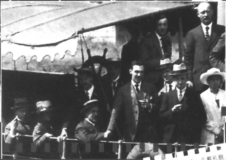
希区柯克站在右边，头戴礼帽，手夹香烟，看起来很潇洒。当时他已经很受欢迎，人们都叫他“希区”。左边是W·A·莫尔，希区柯克在亨利公司的老板，也是帮助他第一次为拉斯基明星公司设计字幕卡片的亲密伙伴。