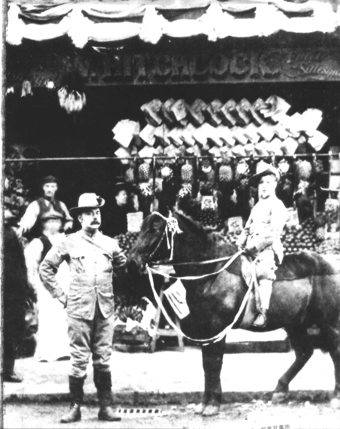
希区柯克与父亲穿着奇怪的衣服，郑重其事地在高路517号的果蔬店门前。时间约为1906年，未来的导演还不到7岁。