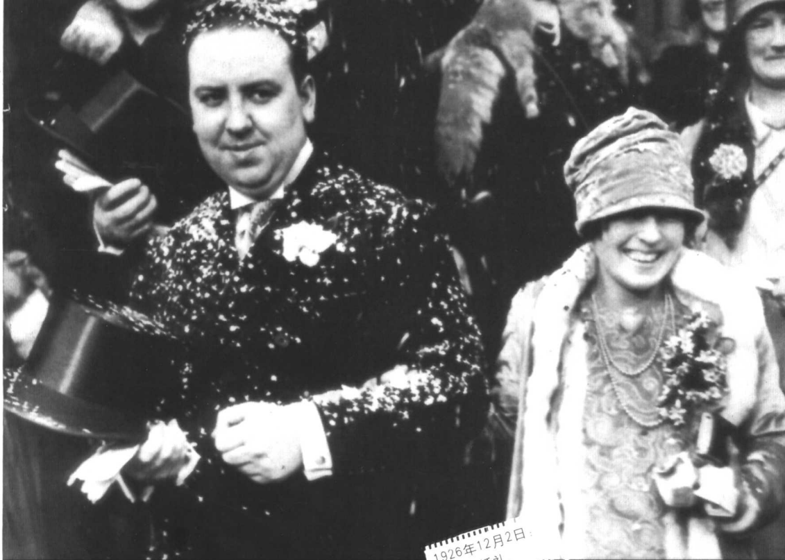
1926年12月2日： 热闹的婚礼。