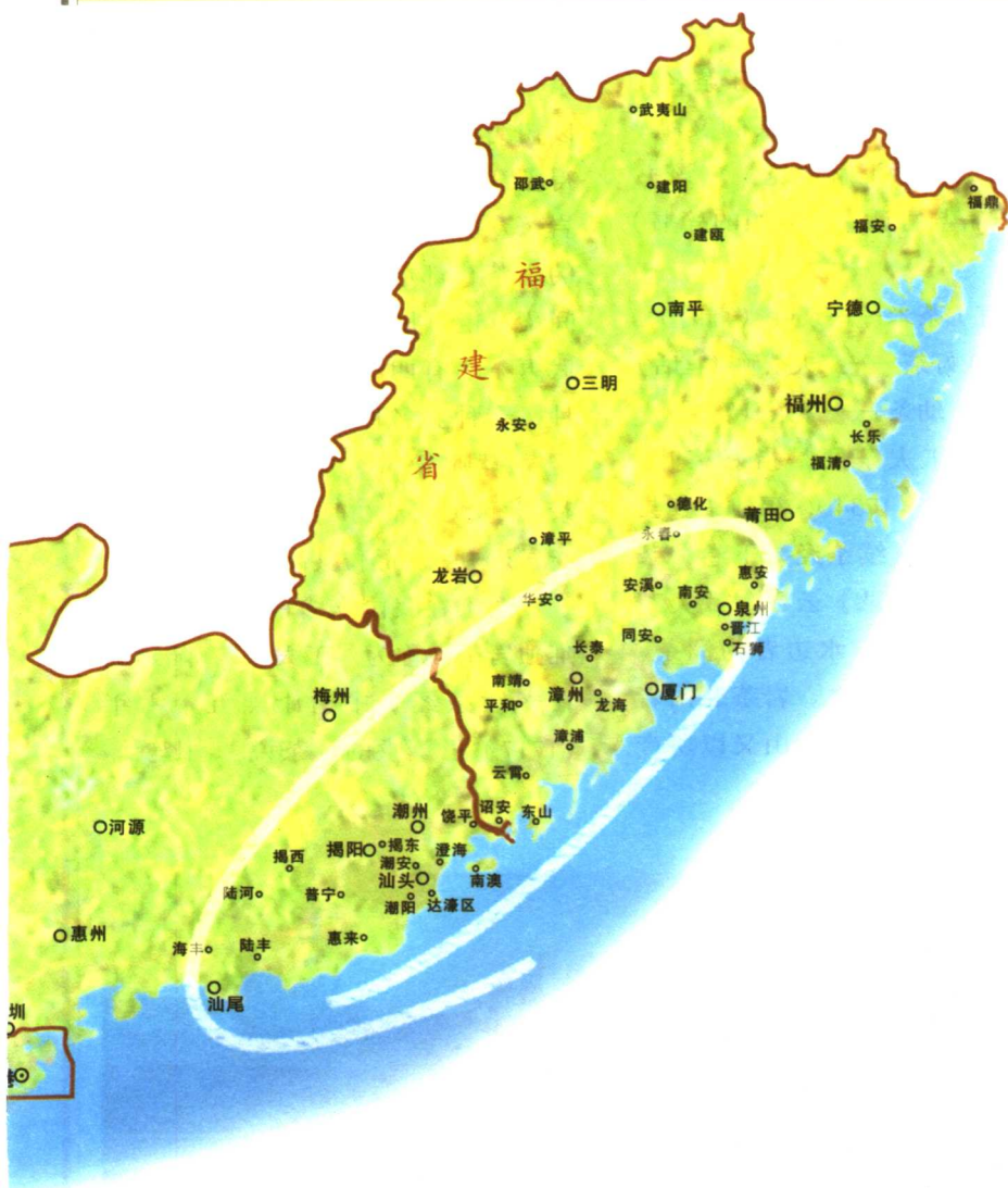
闽南及潮汕地区示意图

闽南三角地区包括厦门市、漳州市、泉州市及其所辖各县；粤东地区包括潮州、汕头、揭阳、汕尾及其所辖各县。