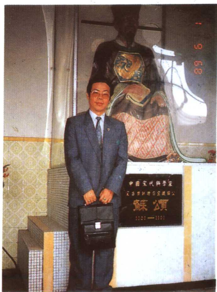
主編蘇克福攝于蘇頌 故居蘆山堂內蘇頌塑像前