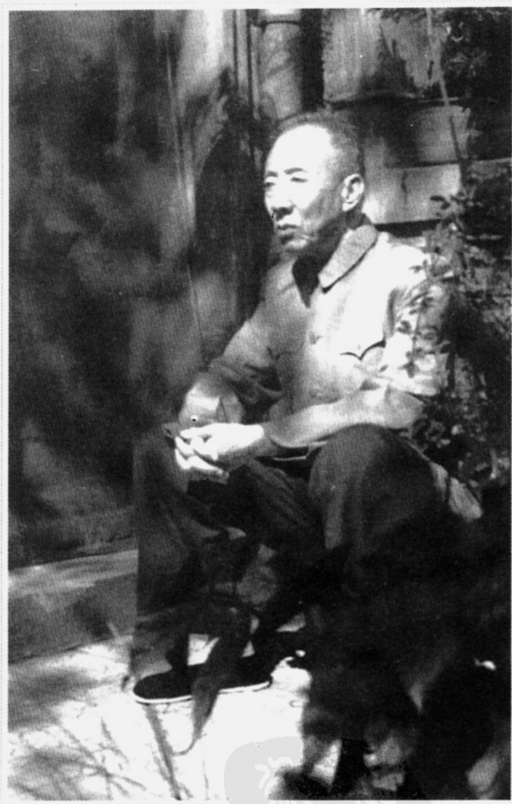
作者像 (20 世纪 70 年代末 天津)