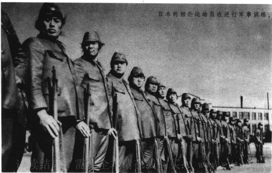
日本的相扑运动员在进行军事训练。

他们以赤条条一无所有形态的民族由海上流到日本岛，居然能够滋生发展、平定土番，造就一个强大的部落，支配并同化许多土著和外来的民族。他们更从高丽、中国、印度输入各种物质的、精神的文明，而且能够通通消化，应用于自己的生活，因而造出一种特性，完成他的国家组织。更把这个力量来做基础，迎着欧力东侵的时代趋向，接受由西方传来的科学文明，造成现代的势力；民族的数量现在居然可以和德法相比，在东方各民族中取得一个先进的地位。这些都是证明他的优点。我们看见日本人许多小气的地方，觉得总脱不了岛国的狭隘性；看见他们许多贪得无厌、崇拜欧美而鄙弃中国的种种言行，又觉得他们总没有公道的精神。可是我们在客观的地位细细研究，日本这一个民族，他的自信心和向上心都算是十分可敬。总理说：一个民族的存在和发展要以自信力作基础。这的确非常要紧，所以那种的“日本迷”也是无可厚非。