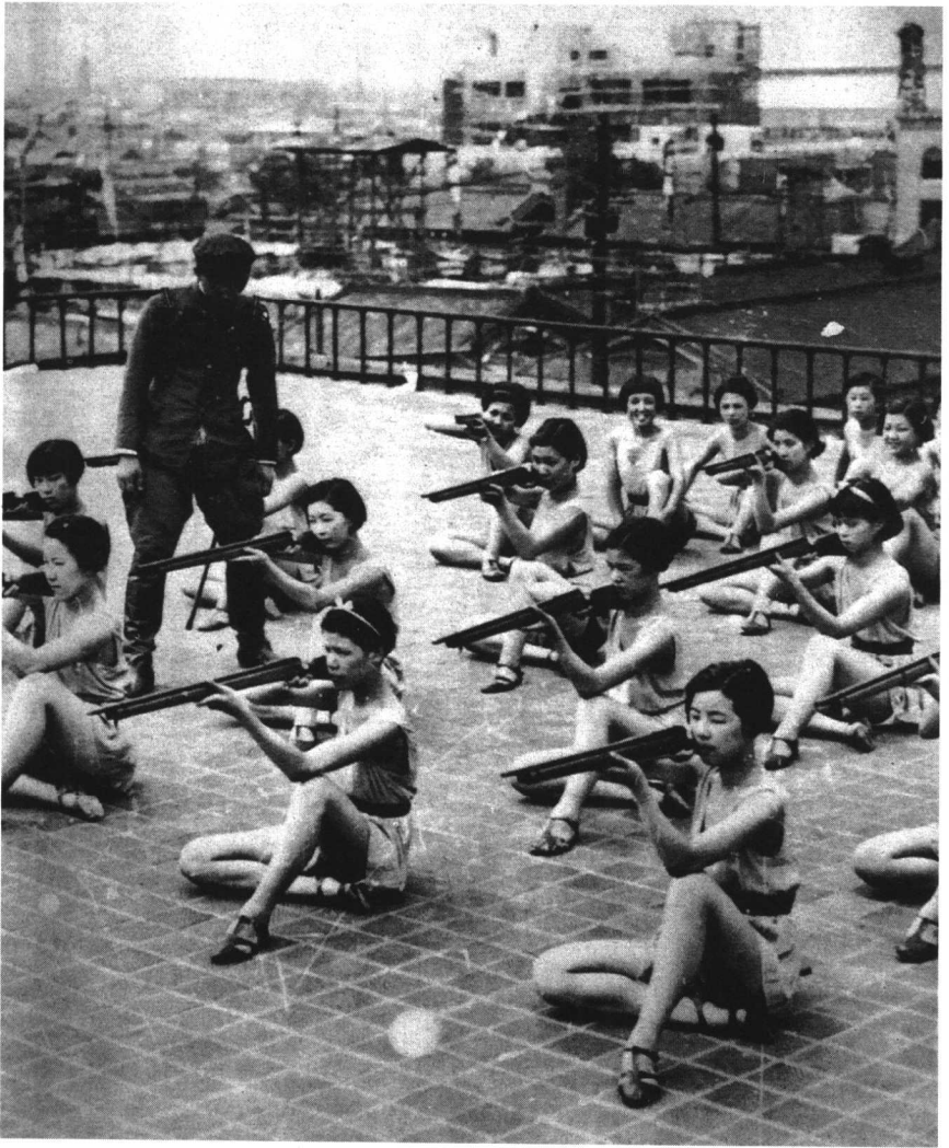
日本为军事化道路进行准备。这是大阪夜总会的舞蹈演员们在一名陆军军官的督导下，练习举枪射击。即使在舞剧中，演员们也要保持士兵的仪态，以体现武士道精神。