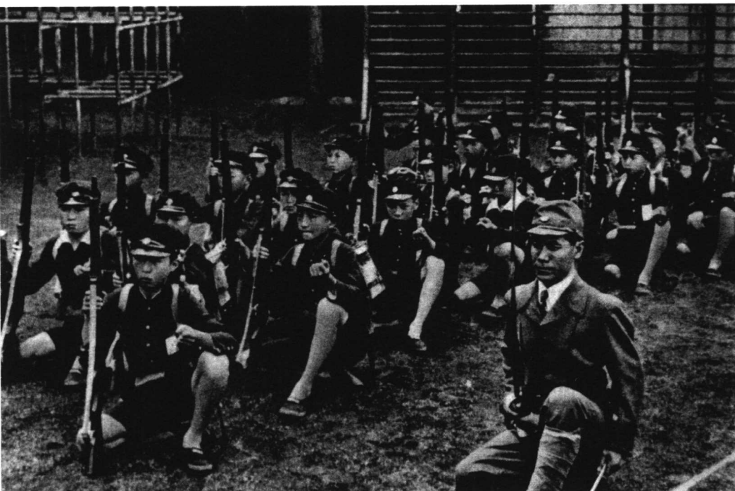
正接受军国主义教育的日本小学生。