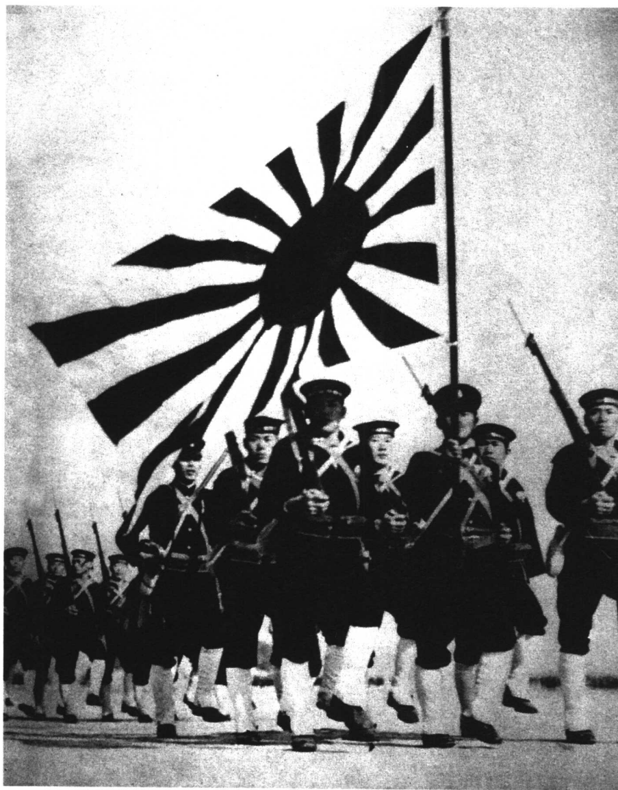
日本海军士兵在太阳旗的引领下，列队行进。他们已经为侵华战争做好了准备。