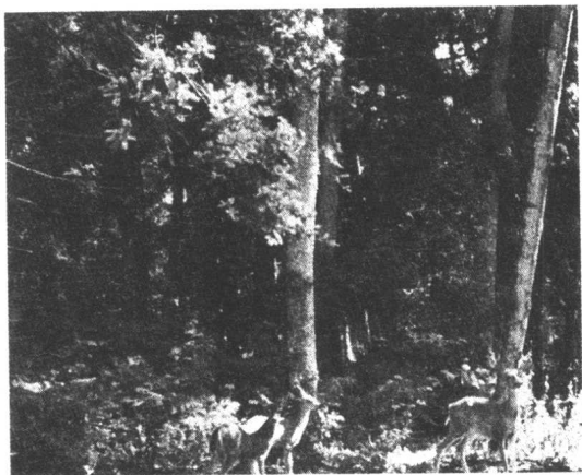
美国华盛顿州的夏季别墅·来庭院里做客的母鹿和小鹿